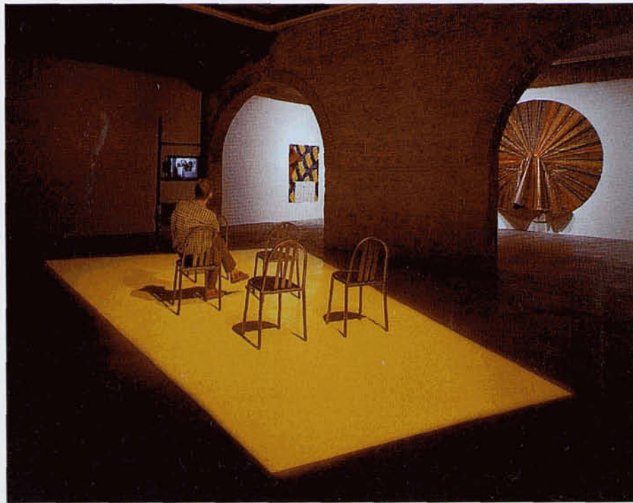
ANTONI MUNTADAS. LES MUSÉES. GALERIE OUEST