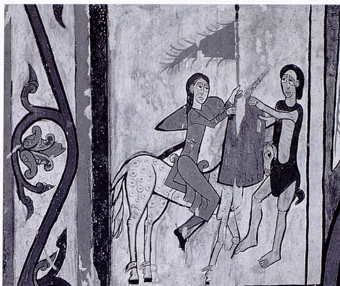
MUSÉE EPISCOPAL DE VIC