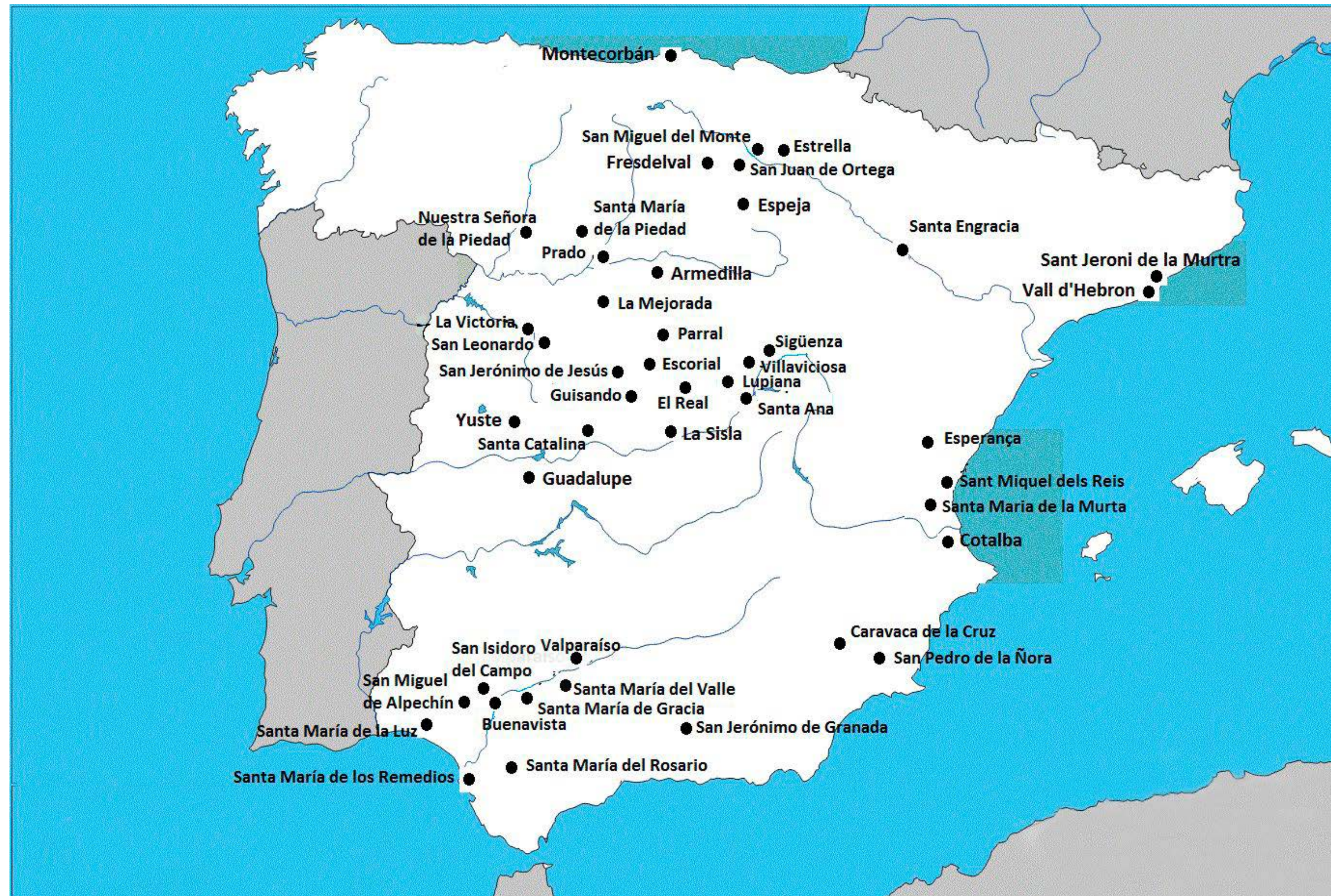
Monestirs de l'orde de Sant Jeroni l'any 1835.

posen de relleu la dificultat que implica la proximitat de dues comunitats: “Como el monasterio de la Sisle estaba tan cerca y tan acreditado no dejó crecer al recién fundado, porque la devoción de la Ciudad de Toledo para con la Orden de San Jerónimo estaba plantada en la Sisle”. 16