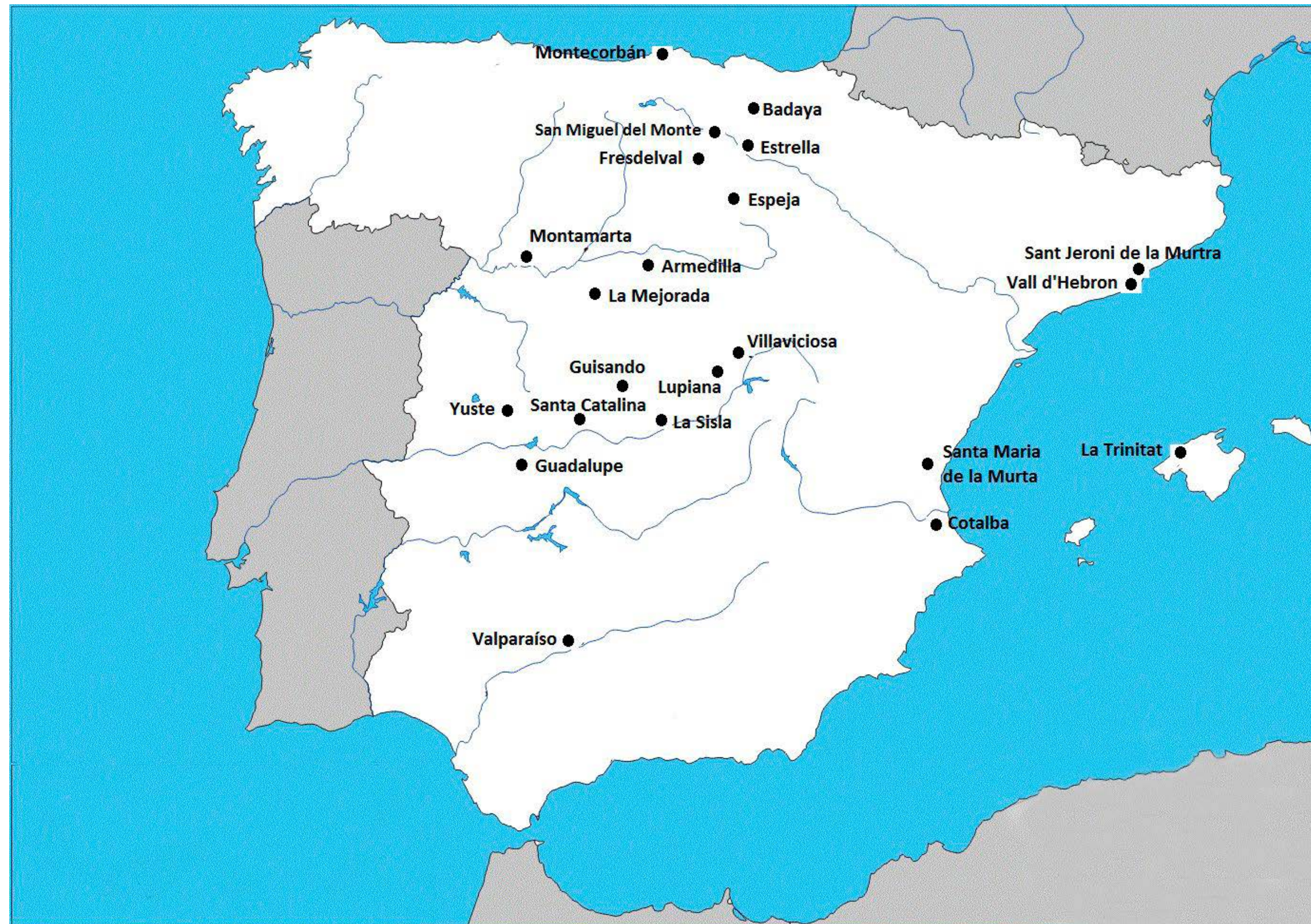
Monestirs de l'orde de Sant Jeroni l'any 1420.

construït ex novo a prop de Barcelona, especialment dissenyat per a la vida cartoixana. Nasqué així Santa Maria de Montalegre (Tiana), que heretà la comunitat de Sant Jaume de Vallparadís el 1415 i que el 1434 rebé la de Sant Pol. S'optà, doncs, per unir dues comunitats petites i fer-ne una de més gran 13 , fet que no s'esdevingué, com veurem, amb els jerònims catalans. L'aposta fructificà, ja que a inici del segle XVIII hi havia a Montalegre més de 50 cartoixans, 30 dels quals eren monjos sacerdots. 14