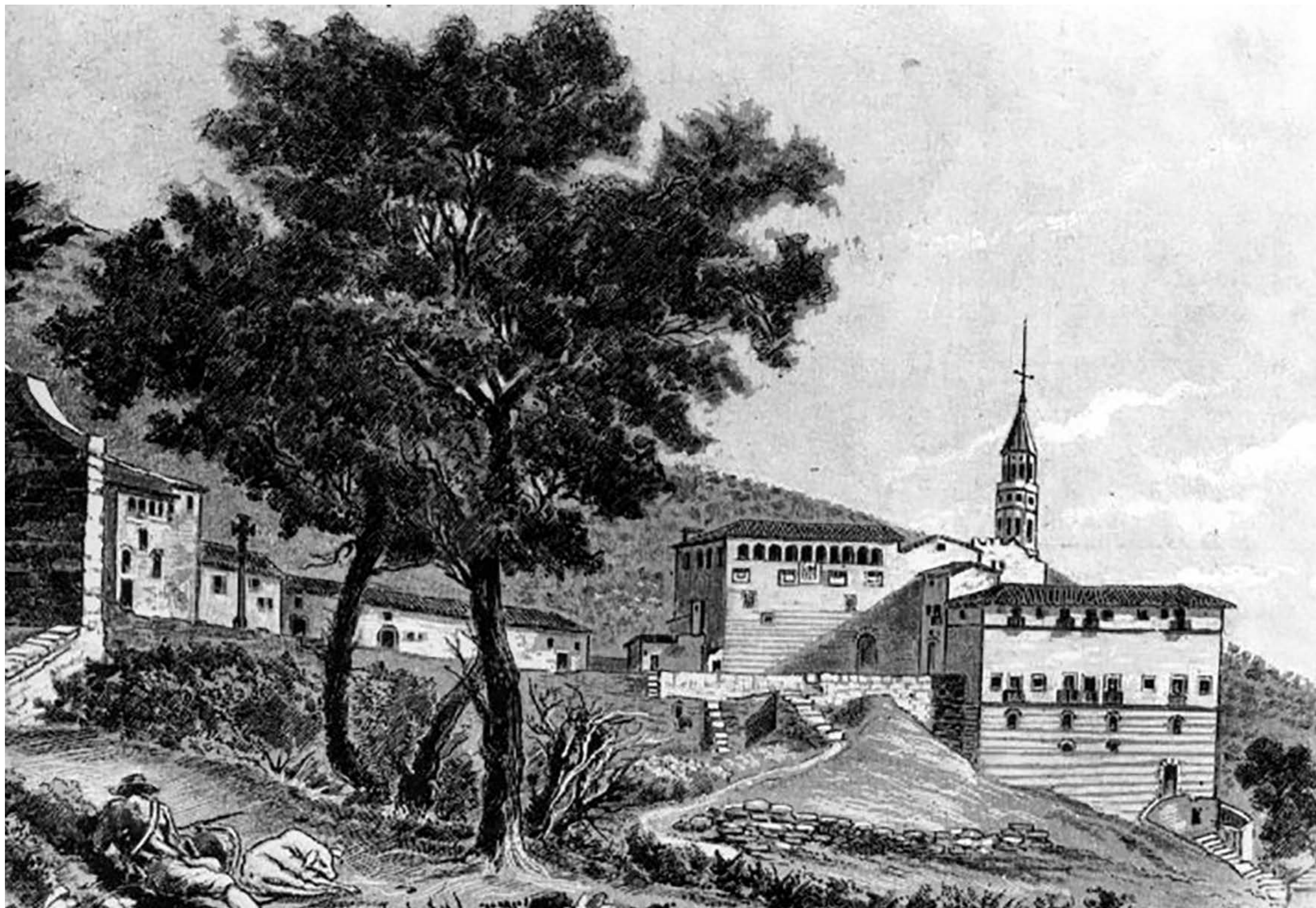
Dibuix de Sant Jeroni de la Vall d'Hebron fet per Pau Rigalt i publicat en el Butlletí del Centre Excursionista de Catalunya, 59 (1899), p. 285.