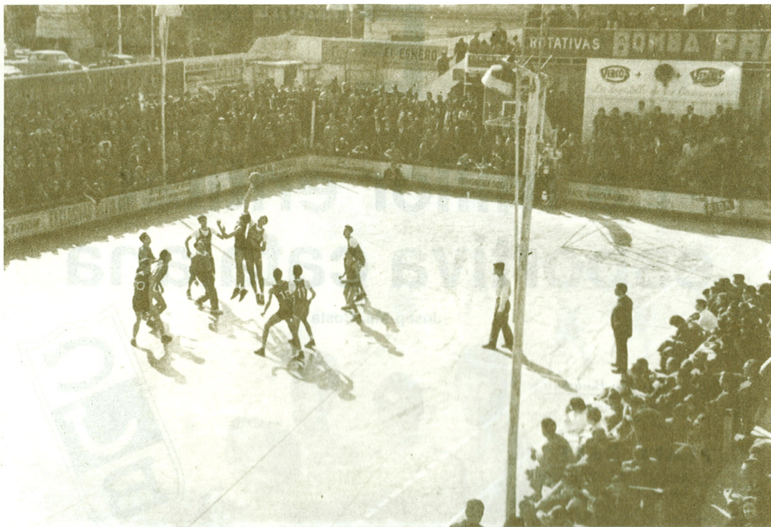
Camp de joc de la Plana, després pavelló municipal regentat pel Club Joventut, reclamat actualment pel municipi.

valors humanes que la idealitzaren, mancats com estem de documents històrics que en garanteixin un perfecte coneixement. Seguint, doncs, el patró de la meva recent publicació «DESPERTA, FERRES!», de tan bona collida en els medis esportius, aprofito aquesta oportunitat immillorable per subministrar nova informació, cada vegada més esblaimada en el record dels vells fundadors d'aquesta agrupació cinquantenària.