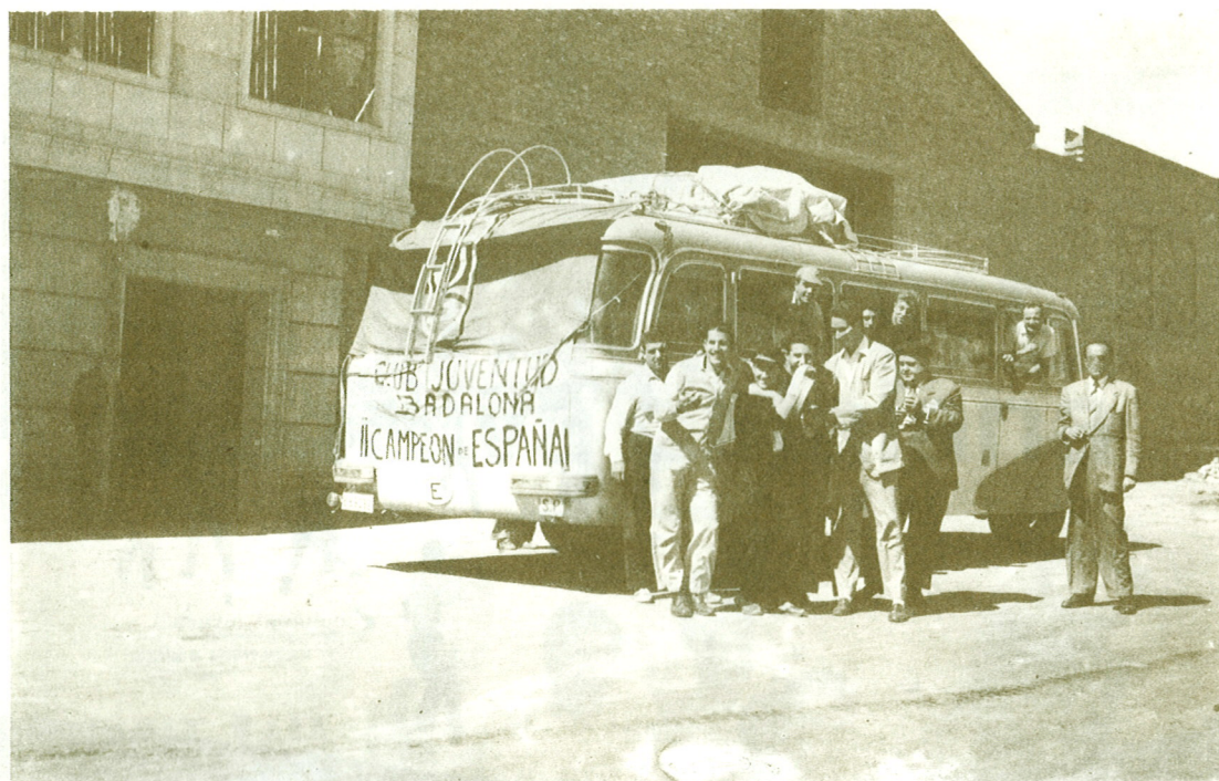
Grup de jugadors que l'any 1953 conqueriren el títol de campions d'Espanya, a Valladolid.

Malgrat tot, el testimoni fidel d'un grapat de protagonistes consultats, ens parla d'un grup de joves esportistes que, en estreta amistat practicaven el basquetbol en un caire recreatiu, a part d'altres modalitats esportives i a part també les seves genialitats espontànies pel veïnat.