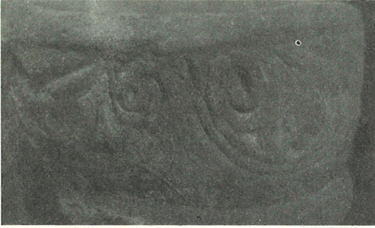
Detall de la decoració de front.