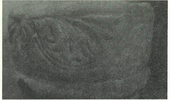
Detall lateral del motiu i motllura de corda.

Aquests motius van ser representats durant tota l'època romànica, d'una manera molt estilitzada, i amb un caire simbòlic molt acusat en obres pre-romàniques del nord-oest de la Península. Fins ben entrat el segle XIII, es poden observar en treballs d'una i altra banda dels Pirineus.