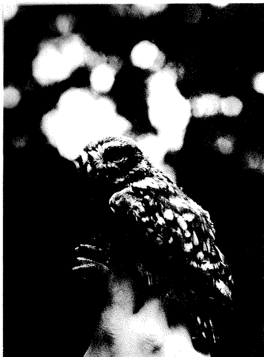
El Mussol ( Athene noctua ) és el rapinyaire nocturn més comú.