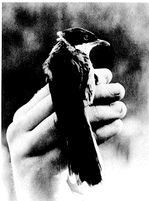
Tallarol cap-negre ( Sylvia atricapilla ). Fou capturat per estudiar-lo biomètricament i per anellar-lo.