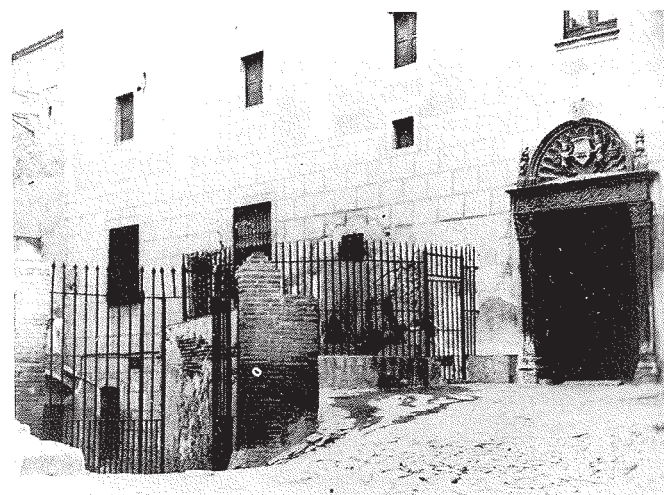
Entrada de la Torre Vella, cap el 1960.

Durant el segle XIII la possessió de drets feudals es convertí, en la nostra zona, en una inversió econòmica i la majoria de torres