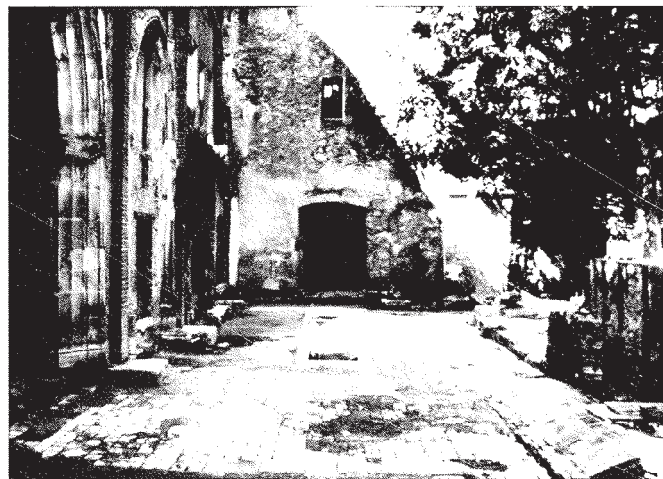
Vista general de l'església des de la capçalera, un cop finalitzada la campanya de l'estiu del 1992.