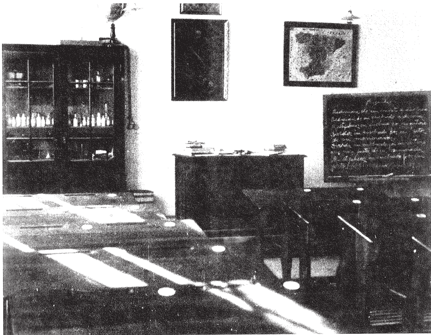
Escola Elemental del Treball, 1928. Fotograma de la pel·lícula sobre Badalona de C. Nyssen. Museu de Badalona. Arxiu d'Imatges