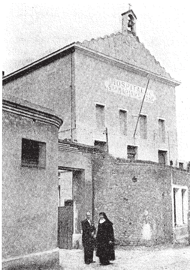
Façana de l'Hospital. Memoria del Hospital de Santa Maria y San José de Badalona , 1943.

El 17 de gener de 1932 s'inaugurava l'Hospital Municipal, i la premsa local – El Clamor , El Eco de Badalona i Aubada – es feien ressò de l'acte. Des de la seva fundació l'Hospital es definí com una institució sanitària de caire benèfic i així ho reflectia el Reglament aprovat el 1932 en el l'article que deia: «La finalitat o objecte que persegueixen les Cases de Guariment de Badalona i La Conreria, és atendre i donar la necessària assistència als malalts pobres residents en aquesta població i als transeünts que sofreixin malalties de caràcter agut, traumàtic o infeccios».