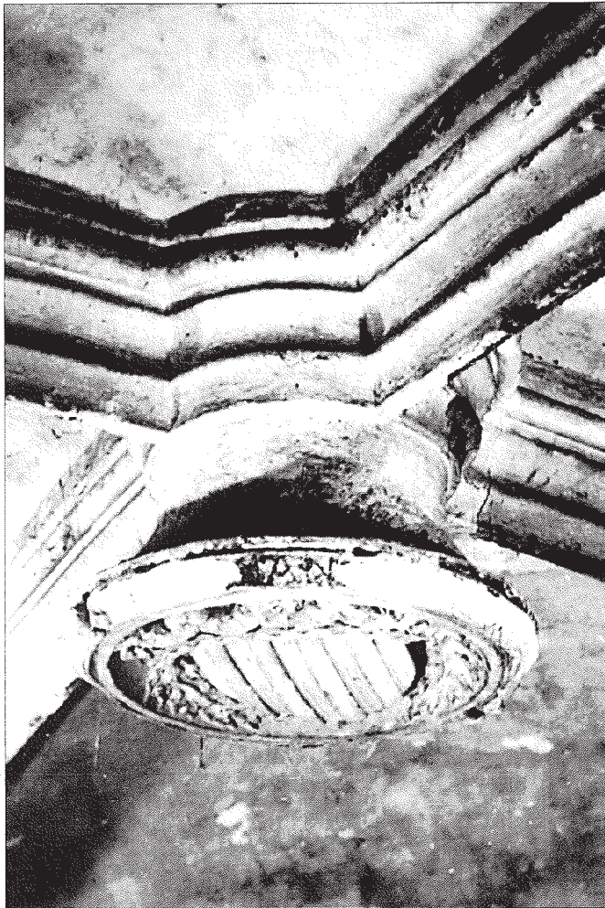
Clau de volta abans de la restauració