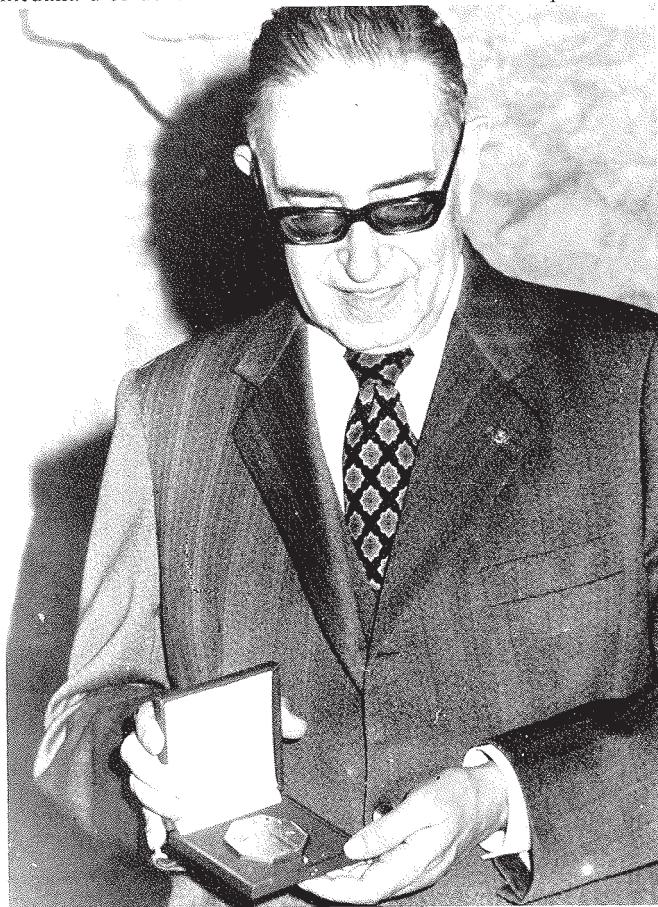
Lliurament de la medalla d'or de l'Associació Internacional d'Amics dels Museus. 1 de juny del 1979.

El 23 de maig de 1967 l'Ajuntament de Badalona li lliurà la medalla d'or de la ciutat. El 23 d'abril de 1971 la Diputació de