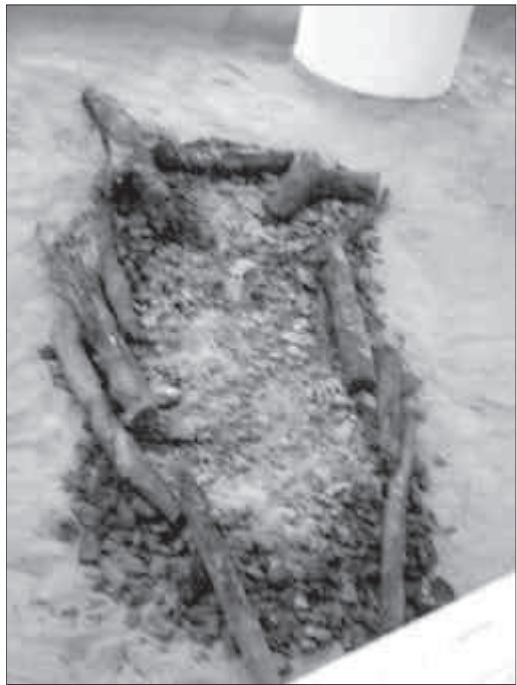
5. Reconstrucció d'un ustrinum o espai on es feia la cremació.

ven processó amb planys de dolor. El ritual funerari entre els ibers, respecte al tractament del cadàver, era la cremació. Només els nadons, o nens de molt poca edat eren inhumats i enterrats sota mateix del sòl de les cases. Així, doncs, el cadàver era col·locat sobre una pira de llenya i es procedia a la seva cremació (fig. 6). Un cop acabada, les restes dels ossos que no s'havien consumit eren rentats curosament i posats en una urna, que també podia ser una àmfora, que es dipositava a l'interior del forat que s'havia obert a terra (fig. 7). Mentre durava tot aquest procés se solia celebrar un banquet funerari que, un cop acabat,