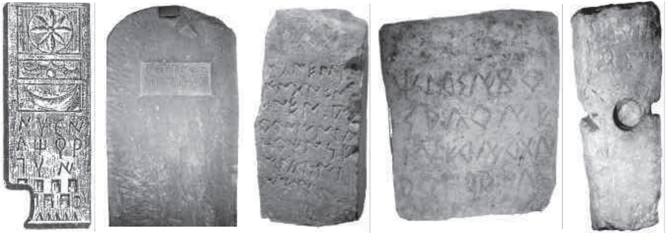
9. Esteles funeràries de Catalunya. 1: Barcelona; 2: Guissona; 3: Santa Perpètua; 4: Civit; 5: Vic. Dibuix 1 extret de Bofarull. Història de Catalunya . Fotografies 2 i 4: Esther Gurri. Fotografia 5: Museu Episcopal de Vic.