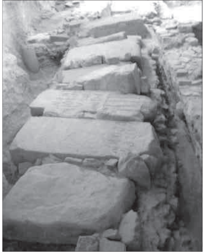
1. Claveguera del cardo maximus a les excavacions de la plaça de Font i Cussó.

L'esmentada campanya arqueològica portada a terme el passat mes de juliol es va centrar en l'excavació d'una gran claveguera romana que anava per sota d'un important carrer prop del fòrum de la ciutat, l'anomenat cardo maximus , que estava orientat en direcció NO/SE (fig. 1). La datació de la claveguera és, per ara, indeterminada, ja que l'excavació no està encara acabada, no s'ha arribat als nivells relacionats amb el seu moment inicial i per tant es desconeix la data de la seva construcció. Es va posar al descobert un tram de 13,5 m d'aquest col·lector i es comprovà que feia 0,80 m d'amplada per 0,90 m de profunditat i que els seus murs estan construïts segons la tècnica de l' opus caementicium . La base d'aquesta claveguera està formada per lloses rectangulars de pedra posades de forma esglaonada per tal de salvar el fort pendent que presenta el carrer, un 29,5% de desnivell. La claveguera estava coberta per grans blocs de pedra en forma de lloses, alguns molt ben escairats.