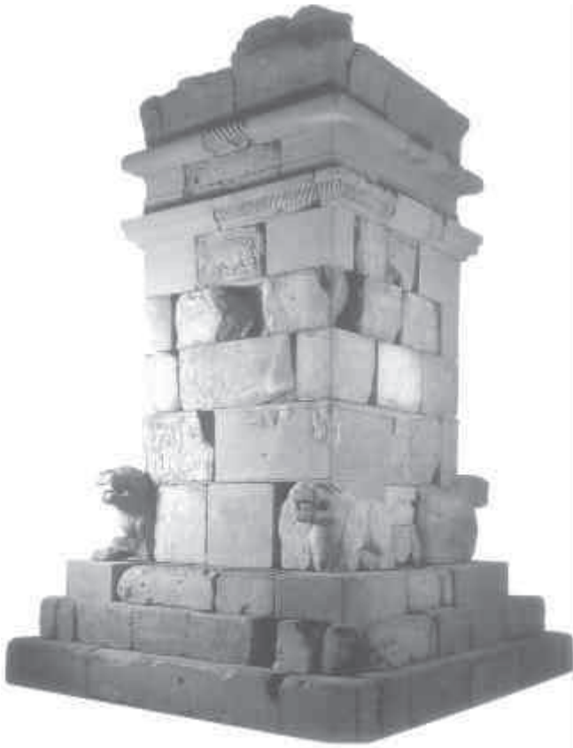
8. Monument funerari turriforme de Pozo Moro (Albacete).

monumentalitat de les tombes i mausoleus de tipus turriforme (fig. 8), moltes vegades decorats amb relleus i escultures exentes, o pilars-esteles, i amb una gran riquesa dels aixovars que acompanyaven els difunts. En canvi, a la zona