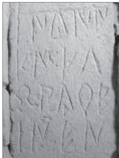
4. Estela funerària ibèrica 2 amb una inscripció en lletres ibèriques.

per al coneixement de l'època final de la cultura ibèrica. Com és ben sabut, la llengua ibèrica constitueix, encara avui, un enigma força impenetrable, tot que els estudis continuats dels diversos investigadors han aconseguit, en molts casos, proporcionar la comprensió gairebé total d'alguns textos. Pel que fa a les dues esteles trobades últimament a Badalona, segons J. Velaza, és interessant estudiar-les conjuntament, ja que una i l'altra estan estretament relacionades. La primera (fig. 3) presenta un nom de persona: MLBE-BIUR, acompanyat de dos sufixos AR MI, que possiblement corresponen a un datiu o a un genitiu. Per tant, la traducció seria «Per a Mlbebiur» o bé «De Mlbebiur». Quant a la segona estela (fig. 4), a més d'una decoració de cinc llances, presenta una inscripció molt més complexa, amb un text