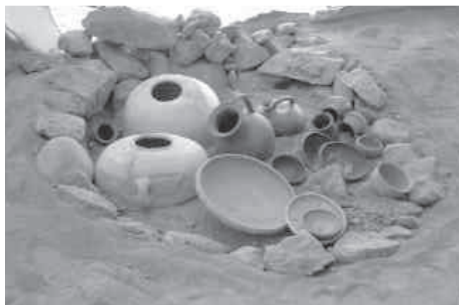
6. Reconstrucció d'una fossa funerària amb l'aixovar i la urna amb les cendres.

Entre els ibers la incineració dels difunts era totalment generalitzada, però també és cert que, a causa de l'amplitud del territori que varen ocupar, la representació física de les sepultures va ser molt diversa segons la situació geogràfica, fruit de les característiques específiques de cada grup. Així, la zona del llevant i sud de la península ibèrica, es caracteritza per les necròpolis extenses, amb una important