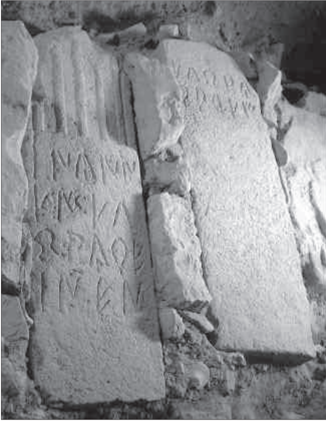
2. Les dues esteles ibèriques tapant la claveguera del cardo maximus .

Va ser precisament en treure el nivell que cobria aquestes lloses de coberta que varen aparèixer les dues esteles funeràries amb inscripció ibèrica (fig. 2). Ambdues esteles tenien la part corresponent a l'epigrafia a la cara superior, de manera que, en treure l'estrat, les inscripcions varen quedar a la vista i es