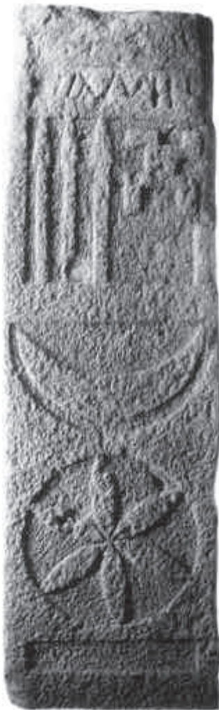
5. Estela funerària ibèrica de can Peixau, decorada i amb una inscripció en lletres ibèriques.

un canvi en la formulació onomàstica ibèrica entre una i altra inscripció. És a dir, mentre en una inscripció, la del pare, aquest s'identifica simplement amb un nom únic, en la segona, trobem també el nom del difunt, el fill, però amb indicació específica de la seva filiació. Tot i que els epígrafs funeraris ibèrics indiquen ja una primera relació entre el món indígena i el romà, aquesta manera d'utilitzar les fórmules posant la filiació del difunt, indica que el personatge del fill mor en un moment en què els gustos i costums romans estan ja plenament assimilats per part dels ibers els quals, en aquests moments, els copien literalment en les seves làpides.