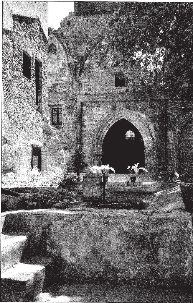
Capella del Roser, antigament dels Set Goigs, darrere de la font de Sant Miquel.

dels peus del temple al prebisteri, la del Sant Crist, la de Nostra Senyora i la dels Set Goigs, construïdes a mitjan segle XV. A la part de l'Evangelí, només hi havia la de Sant Miquel, construïda a principis del segle XVI.