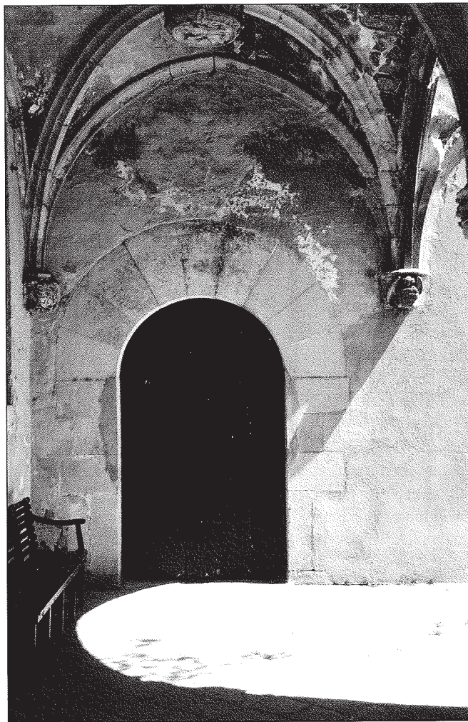
Portal de Maria Mater, al fons de la galeria de tramuntana del claustre. Fotografia de l'autor.

La biblioteca fou objecte d'un trasllat a l'Obra Nova, 48 abandonà, doncs, el seu emplaçament original al pis superior del claustre, on la trobem l'any 1551. La ubicació era amb tota probabilitat a la galeria de llevant, 49 com es desprèn del text següent: «M o Lluís Clos féu en aquesta conjuntura dues