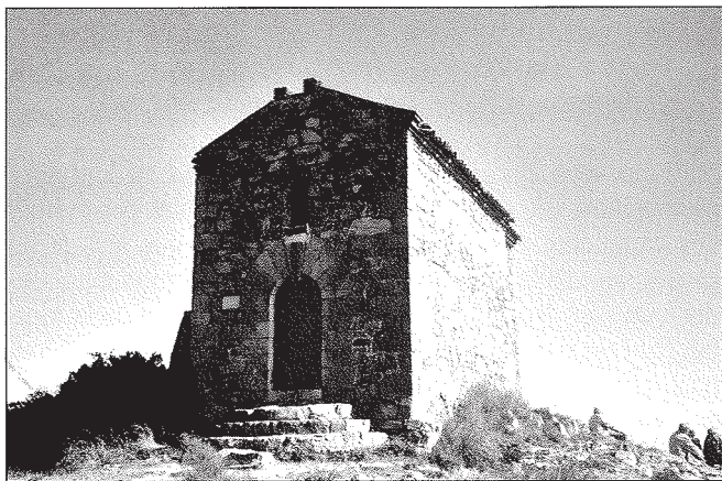
Ermita de Sant Onofre.

L'aigua emprada per al consum era la procedent d'una font que era situada prop del safareig gran, proper al cap de la parra. Entrava al monestir per la cuina. D'aquesta passava al claustre i al seu sortidor central, per dirigir-se a la part de tramuntana, perquè en disposessin el celler, el forn, la casa de les bugades i la infermeria. La canalització es dirigia després en direcció sud cap al safareig i sortidor del pati de la infermeria i la sagristia, mentre que un ramal conduïa l'aigua cap a la porta de l'era. Tot i trobar-se documentades despeses referents a canons i aixetes a mitjan segle XV, 69 la darrera canalització a què es refereix la present descripció, l'hem de situar a principis del segle XVI, com es dedueix de les paraules del cronista: «Una obra féu regaladíssima encara que de poc cost, que posà l'aigua nova dins casa amb canonada de terra, pel