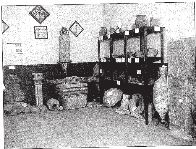
Sala d'arqueologia del Museu de Badalona. Any 1933.