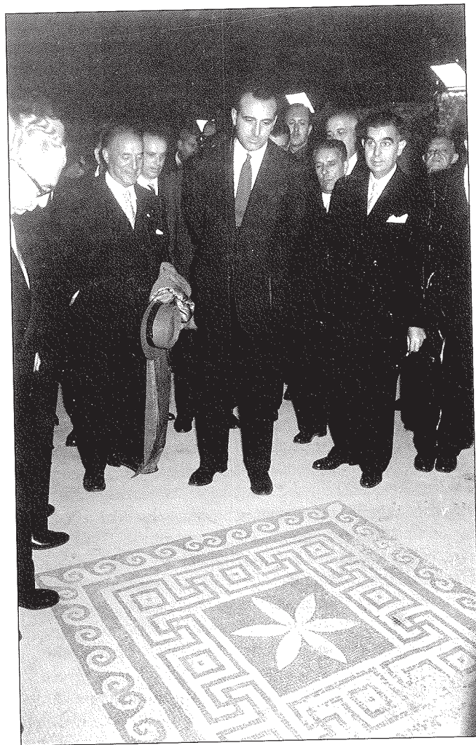
Joaquín Ruíz Jiménez, ministre d'Educació, visitant les termes de Baetulo. Any 1955.