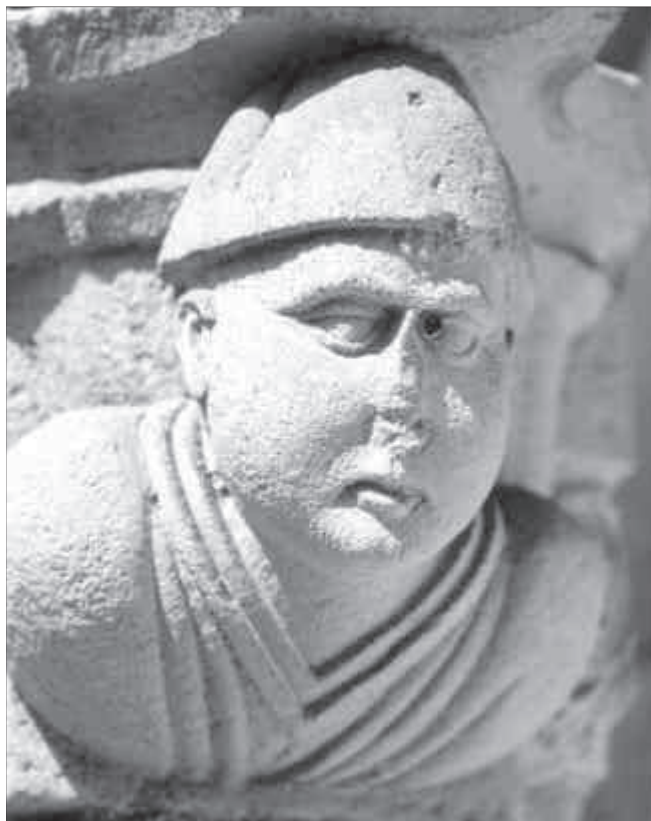
Ménsula del claustre que segurament retrata Bertran Nicolau. Museu de Badalona. Arxiu d'Imatges. Fotògraf: J. Lluís García Surrallès.

Quina era la situació de Benet XIII el 1403? Aquest any fou clau en la seva trajectòria, ja que al mes de març finalitzà un setge de gairebé cinc anys al qual el sotmeteren els francesos, i quedà reclòs a Avinyó amb l'únic suport de la Corona d'Aragó. S'ha de tenir en consideració que el papa Luna es trobà immers dins la lluita que suposava la divisió de l'Església en dues obediències, raó per la qual el seu pontificat no fou gens estable, ja que havia de procurar d'atreure's la submissió dels diferents regnes cristians enfront dels papes romans. La finalització del setge, burlat per la fugida del papa disfressat de cartoixà, i el posterior establiment de la cort pontificia a Castellanrenard de la Provença modificaren l'equilibri diplo-màtic