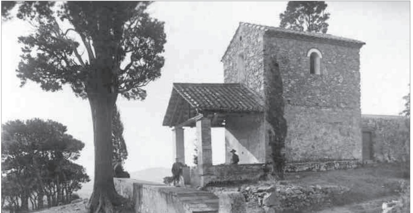
L'ermita coneguda per «la Miranda», cap a l'any 1930 en una postal editada per Casa Riera.

cament, de l'esforç historiogràfic realitzat en el mateix monestir a principis del segle XVII, part del qual fou aprofitat per Sigüenza. D'aleshores ençà, les referències a les fonts documentals directes han estat gairebé nul·les, possiblement perquè la narració dels esdeveniments, que tot seguit extractem, era ja força exhaustiva.