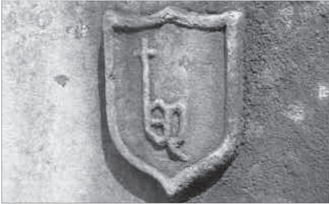
Escut de Bertran Nicolau al brollador central del pati del claustre de Sant Jeroni de la Murtra.

14.000 lliures barcelonines. El següent 20 de novembre, cinc frares procedents de Sant Jeroni de Cotalba i dos de la Vall d'Hebron, iniciaven la llarga trajectòria de la nova comunitat monàstica que, gairebé sense interrupcions, s'allargarà fins al fatídic 1835. Dos dies més tard, el 22 de novembre de 1413, el vicari episcopal confirmà el primer prior, fra Joan Ponç. 12