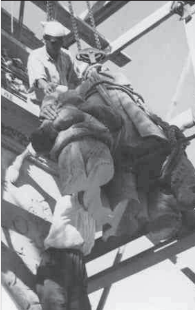
Procés de desmuntatge del monument, l'any 1936. Museu de Badalona.