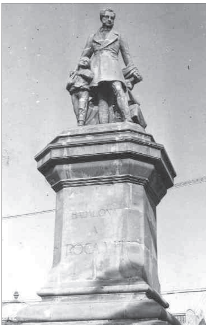
Vista del nou pedestal.