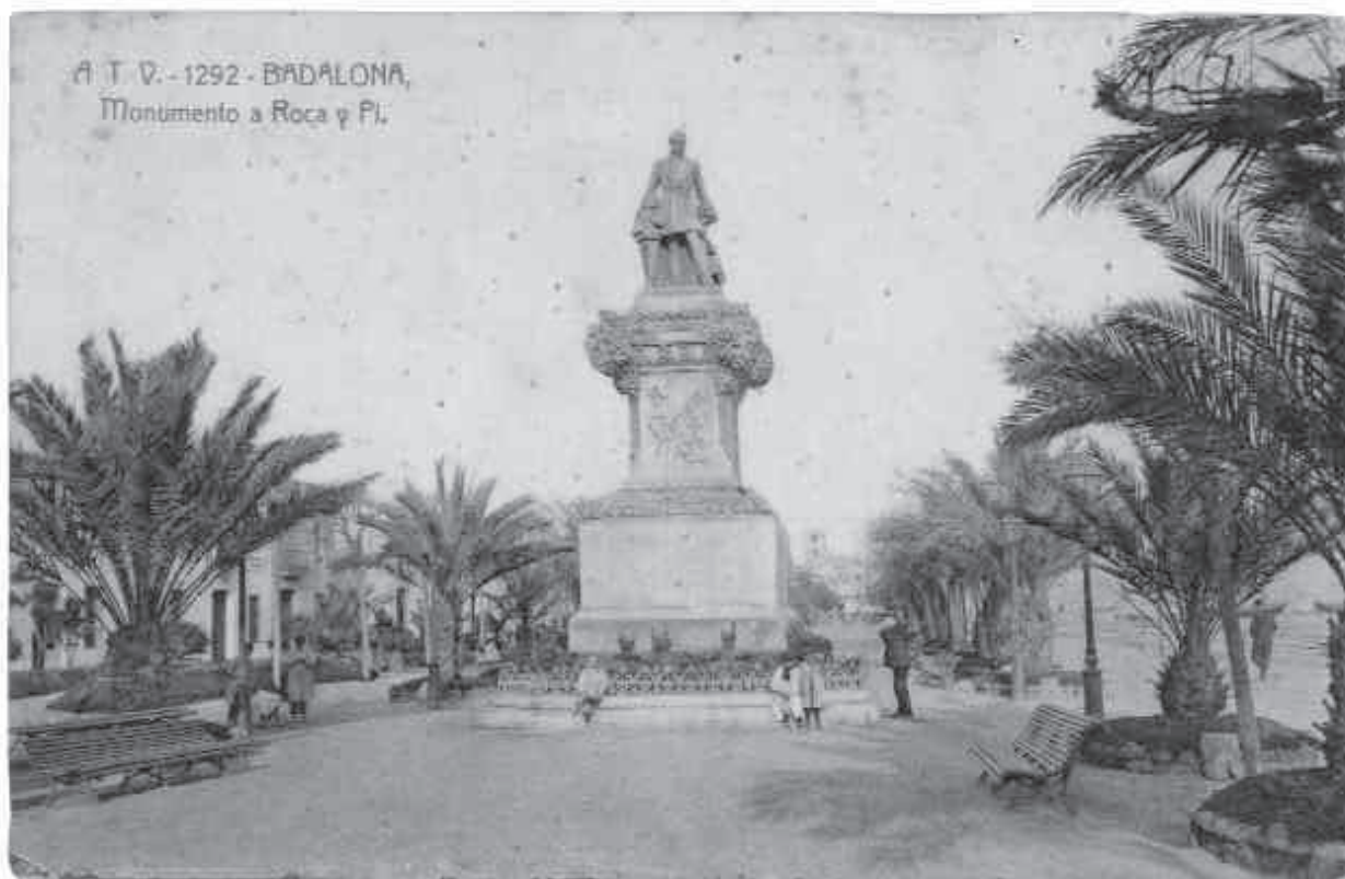
Vista frontal del monument amb el pedestal original. Museu de Badalona. Arxiu Josep M. Cuyàs i Tolosa. Fotògraf Àngel Toldrà Viazó, [191?]

activitat va centrar-se a Amèrica, abans de marxar va deixar-nos uns bons exemples de la seva destresa escultòrica. Aquest és el cas del fris lateral esquerre de l'Arc de Triomf de Barcelona o de tres estàtues i diversos relleus a l'edifici del Tribunal de Justícia de la mateixa ciutat, entre molts d'altres projectes.