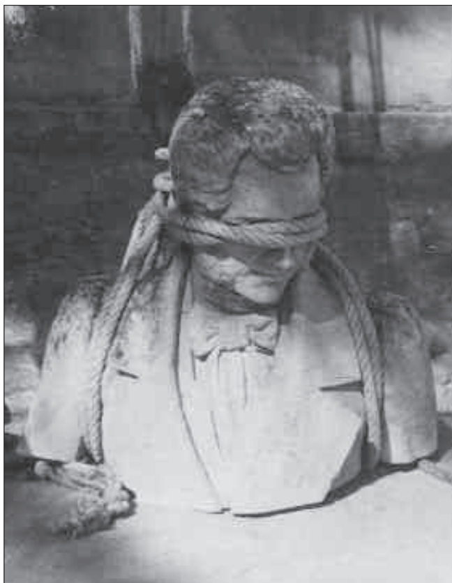
Detall del monument ja desmuntat.

idoni seria el de la intersecció entre la Rambla i el carrer d'en Prim. D'altres creien que havia d'anar al mateix carrer de Roca i Pi, actual Via Augusta, on originalment s'havia projectat de situar l'escultura.