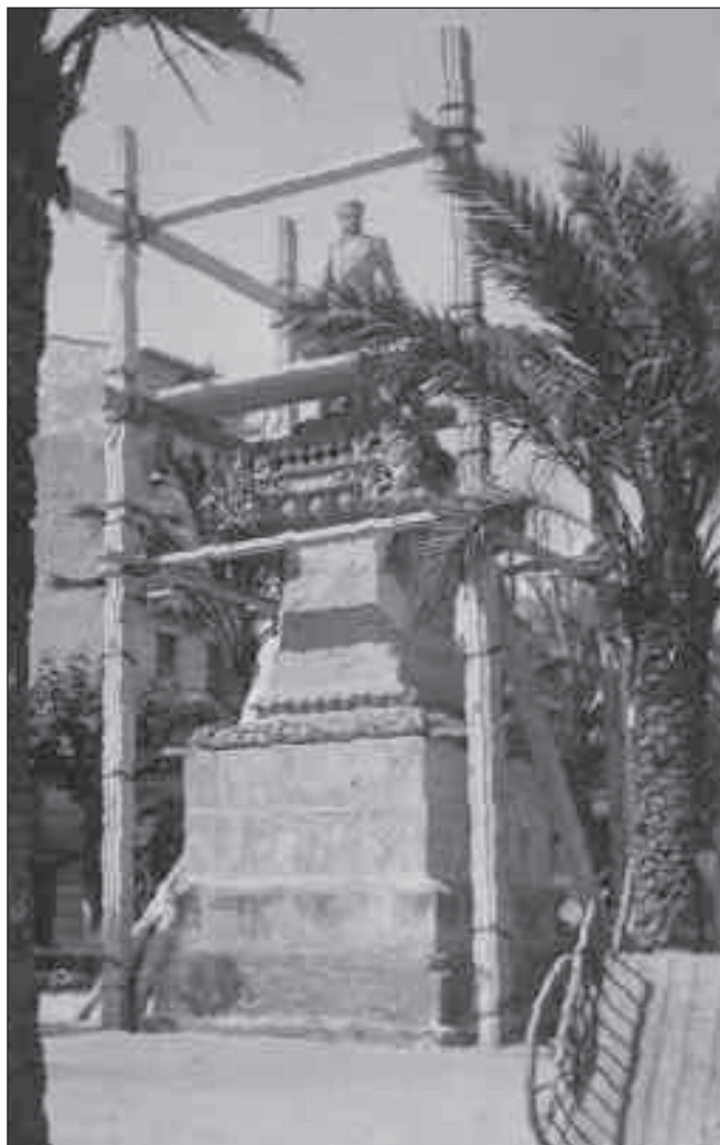
Procés de desmuntatge del monument, l'any 1936.