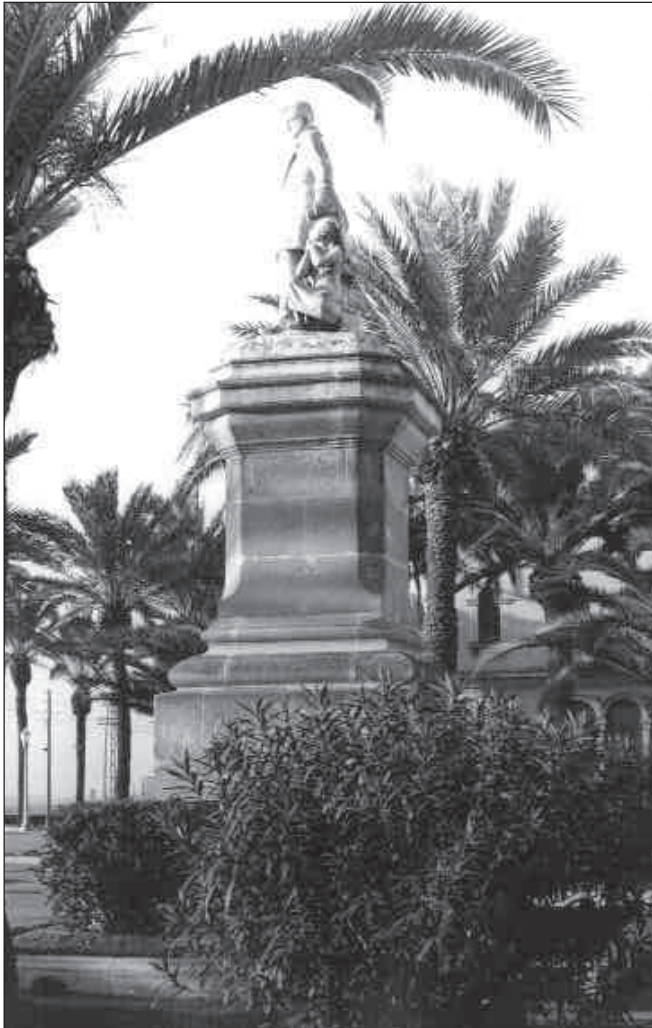
Vista lateral del monument a Roca i Pi amb l'entorn enjardinat, als anys seixanta del segle XX.

escultures dels dos nens i sobretot la de Vicenç de Roca i Pi, es percebin actualment com a camacurtes i capgrosses.