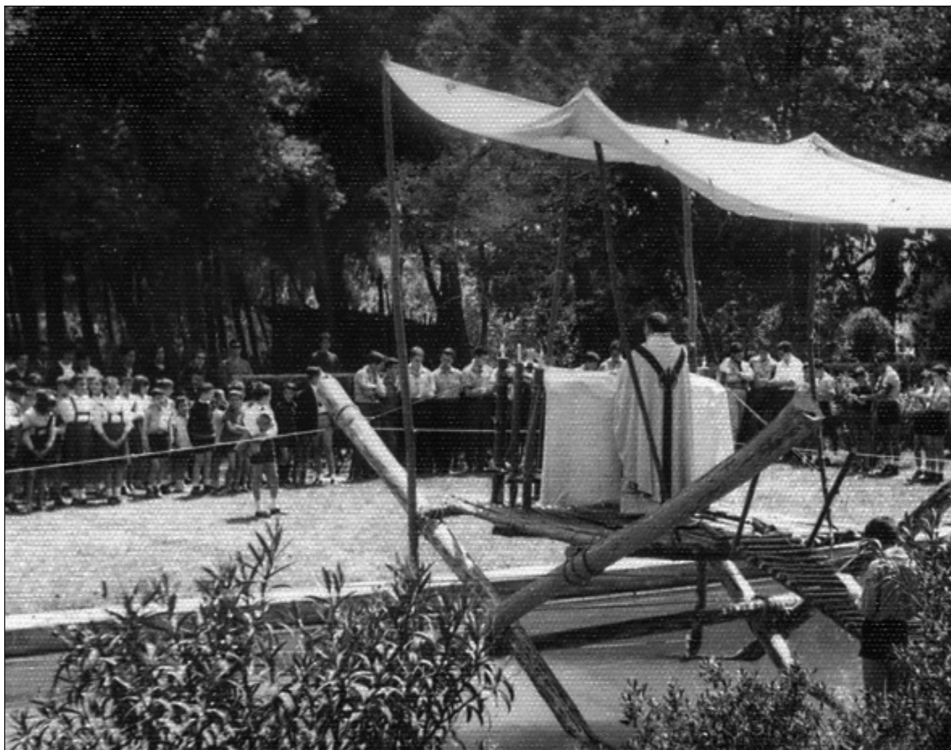
Festa del Badiu celebrada el 1965.