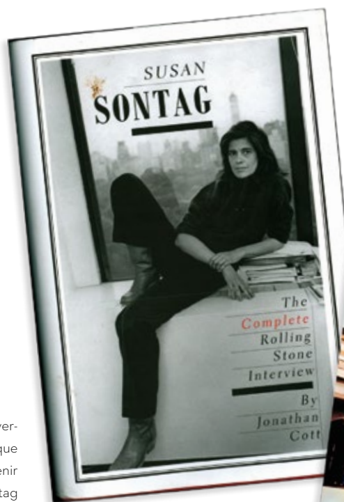
El llibre amb la conversa de dotze hores que Jonathan Cott va tenir amb Susan Sontag