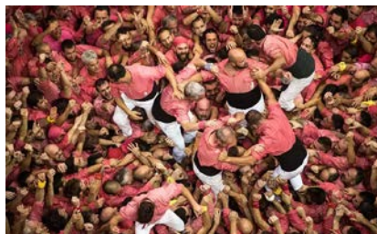
Una de les imatges premiades