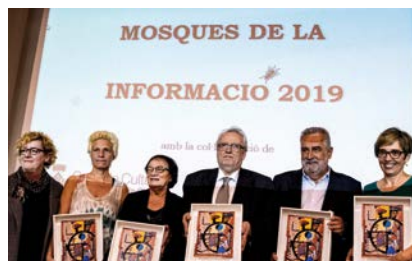
Foto de família dels diferents guardonats