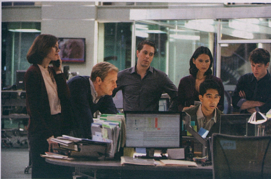
Alguns dels periodistes de The Newsroom , la sèrie ideada per Aaron Sorkin.

històric, com també ho són les sèries d'Aaron Sorkin, que va passar moltes hores a les redaccions de diversos programes per fer aquestes ficcions.