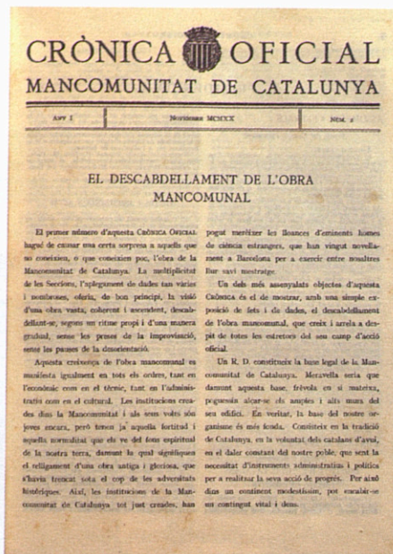
A dalt, a l'esquerra, una portada de Catalunya Gráfica i, a la dreta, un exemplar de Crònica oficial de la Mancomunitat, que es va publicar entre 1920 i 1923. A sota, El poble català parlant de les sessions del dia anterior.