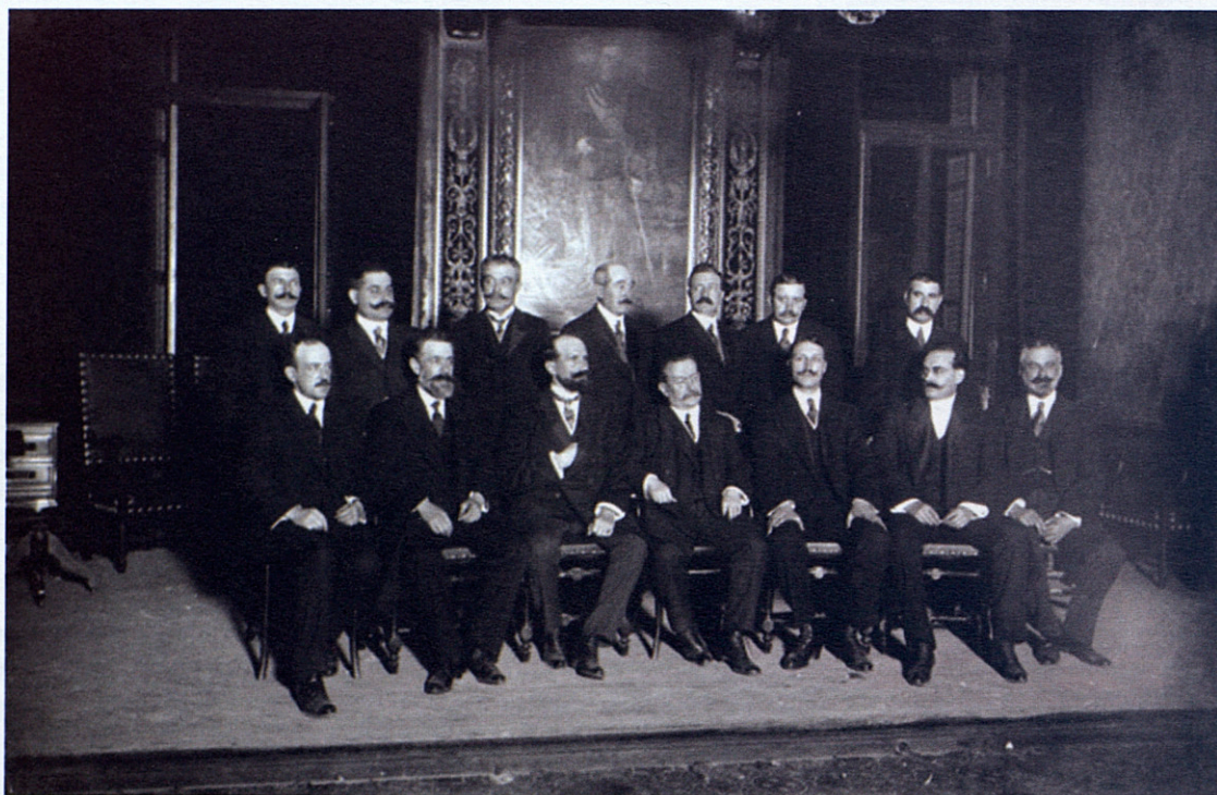
Prat de La Riba, president de la Mancomunitat, amb la resta de membres en l'assemblea constituent al Saló de Sant Jordi.

Els vincles entre la Mancomunitat i el periodisme de l'època expliquen el coneixement que es tenia de la institució