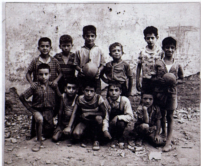
A dalt, a l'esquerra, un imatge del Xino el 1960-61. A dalt, a la dreta, tres homes observen les barricades al passeig Marítim el 1969. A baix, dos imatges d'infants sense datar.