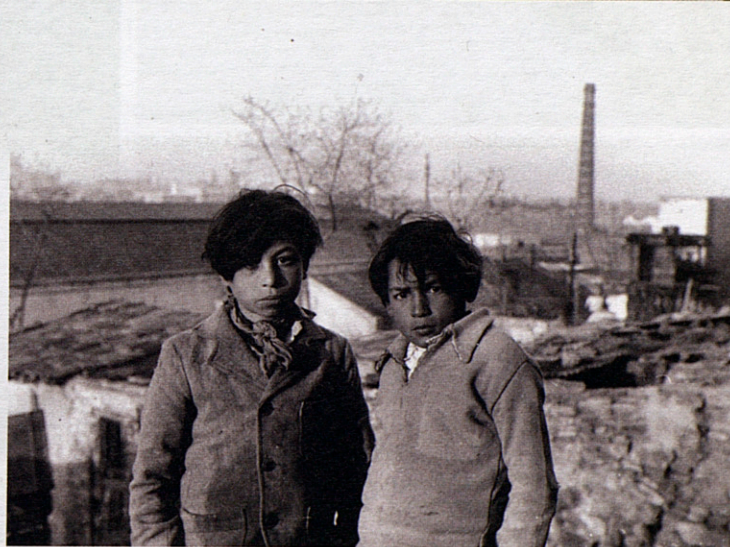
A dalt, a la dreta, una parella amb un nen el 1961. A baix, a la dreta, nens del Somorrostro el 1958. A l'esquerra, a dalt i a baix, dues imatges del Xino sense datar.