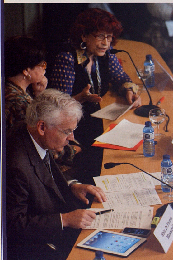
Diferents moments de la taula rodona que es va celebrar a la sala d'actes del Col·legi de Periodistes el passat 23 de juny