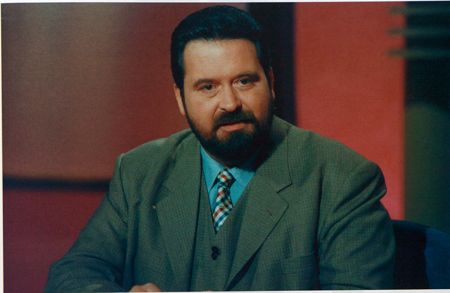
Jordi Estadella va assolir la popularitat als anys vuitanta gràcies a diferents programes de televisió.