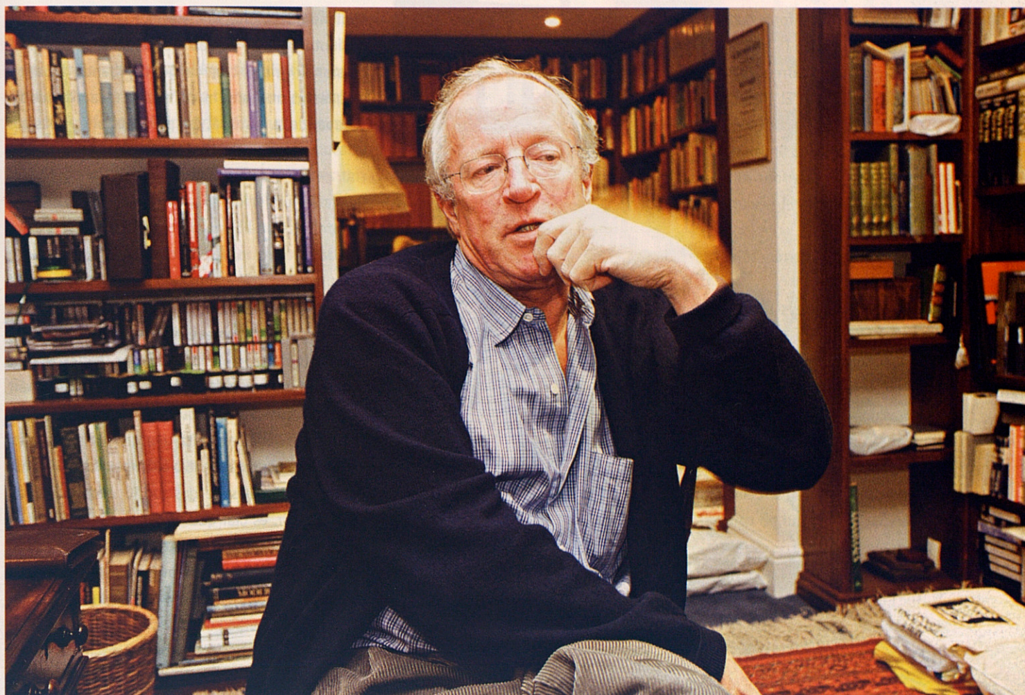
Robert Fisk durant l'entrevista que va tenir lloc a la seva casa, a Irlanda

■ Vostè què creu, que la campanya acabarà en conquesta o en retirada?