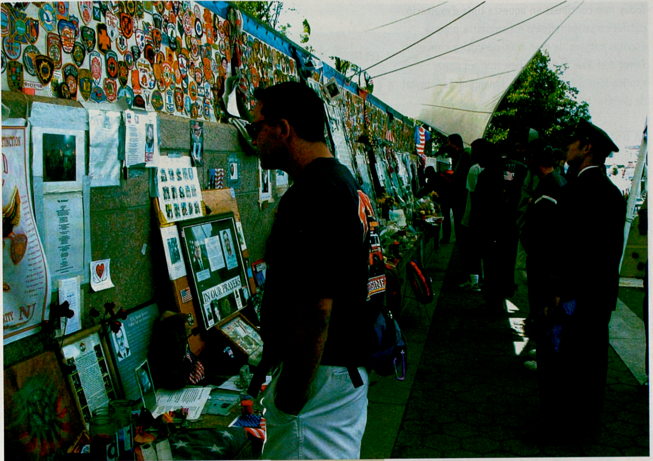
La 'zona cero', un espai molt concorregut el setembre passat

ensenyar aquestes imatges, s'expliquen: "La pregunta és: s'informa o es causa un dolor inútil?" Els que, com la CBS, van difondre la imatge, també es justifiquen: "Això és el terrorisme (...) d'una banda, es volen respectar els sentiments del telespectador, de l'altra, es vol mostrar el que els terroristes han comès realment."