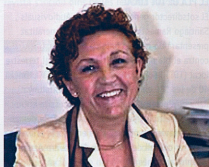
Carmen Caffarel, nova responsable de RTVE

La catedràtica Carmen Caffarel Serra serà la nova directora general de Radiotelevisió Espanyola (RTVE) fins que s'aprovi el nou estatut de l'ens promès per José Luis Rodríguez Zapatero en la seva campanya electoral. Caffarel és catedràtica de la Universitat Rey Juan Carlos I de Madrid, és especialista en estudis de comunicació i el seu efecte social.