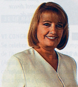
María Teresa Campos deixarà Tele 5 per anar a Antena 3TV