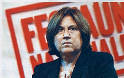
Lucia Annunziata dimiteix del seu càrrec

El president de la Generalitat, Pasqual Maragall anuncia en el Parlament que els mitjans públics de la Generalitat seran redimensionats i no