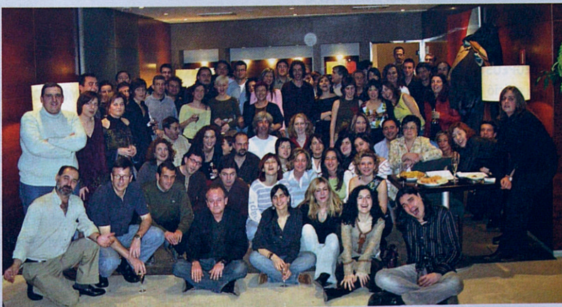
Foto de família de la Festa Anual dels Periodistes de Lleida

La Demarcació de Lleida del Col·legi va celebrar el dia 2 d'abril la Festa Anual dels Periodistes de Lleida. Tingué lloc a l'Hotel AC Lleida i va consistir en un còctel fred i calent, seguet de ballaruga. Durant la festa es van pas-