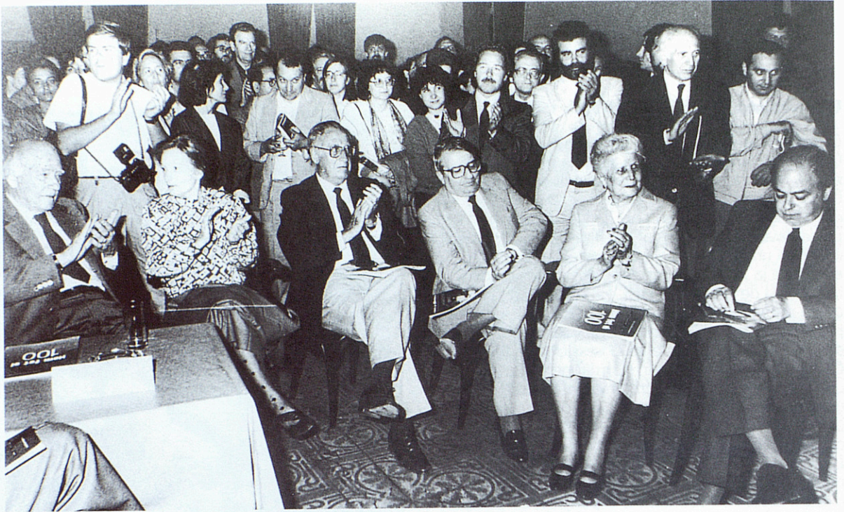
Els presidents Tarradellas i Pujol, al bar Universal de Barcelona, en la presentació del número 100 del setmanari, el 15 de maig de 1986.

l'espectacularitat. Les grans entrevistes, els reportatges d'investigació i les anàlisis marquen la pauta. Diverses informacions impactants, com la publicació en exclusiva del secret més ben guardat dels Jocs, el guió de les cerimònies inaugural i de cloenda, catapulten la publicació, especialment en els àmbits polític i universitari. Però la rigorositat no està renyida amb el manteniment de l'estil desimbolt i informal ni amb una millora molt notable de la presentació. Enric Satué fabrica una nova maqueta i, en paral·lel, l'infografisme es consolida com una altra de les marques de la casa. El Temps ja es fa aleshores a tot color i amb un paper molt allunyat del tímid mig de diari de l'inici. En la batalla per l'audiència diversos mitjans posen de moda el costum de regalar coses. I El Temps no en pot quedar al marge, de manera que comença a preparar operacions promocionals. Ja havia fet alguna cosa anys enrera amb el còmic i el rock. Ara llança la gran campanya dels fascicles del Tirant , amb impactants anuncis televisius, que posen la publicació en el seu nivell més alt, amb seixanta mil exemplars de venda. Aquesta campanya la seguiran d'altres amb les lletres del rock català i els vídeos del programa "Mediterrània".