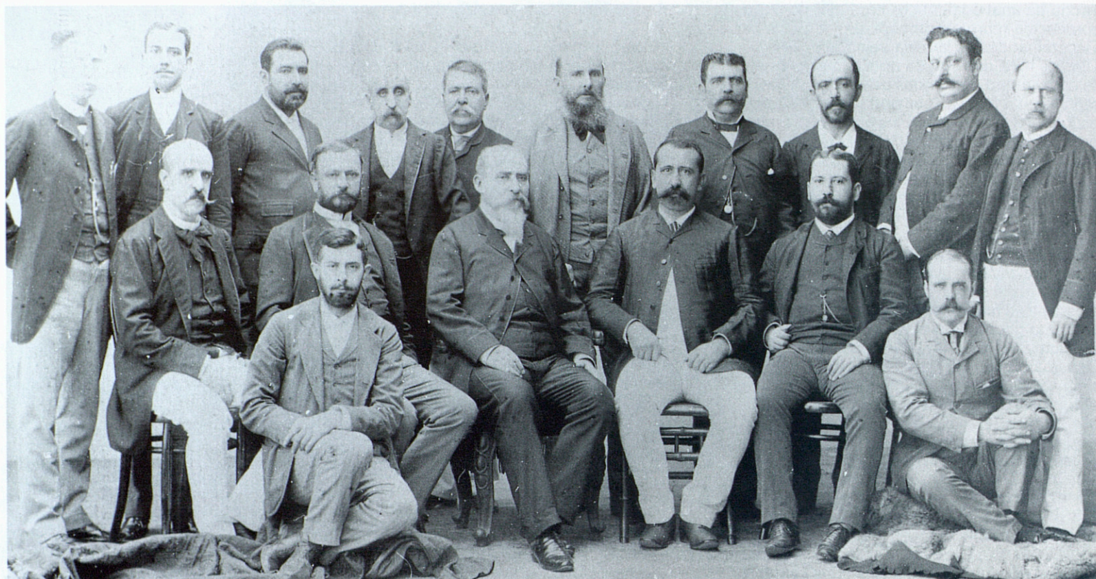
La directiva de la Companyia de Tabacs de Filipines, el 1890. (Foto: Fons Tabacs de Filipines de l'ANC). A la dreta, Francesc Macià saludant la senyora Torrents, guanyadora de la travessia al port de Barcelona, el 18 de setembre de 1932. (Foto: Domínguez, del Fons Francesc Macià, ANC).