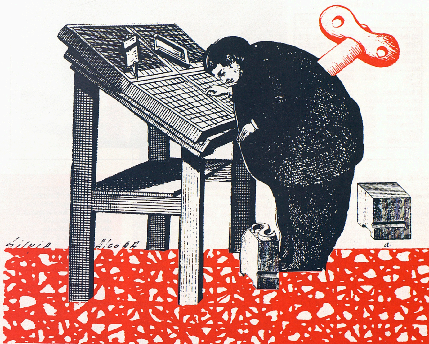
IL·LUSTRACIÓ: SÍLVIA ALCOBÁ