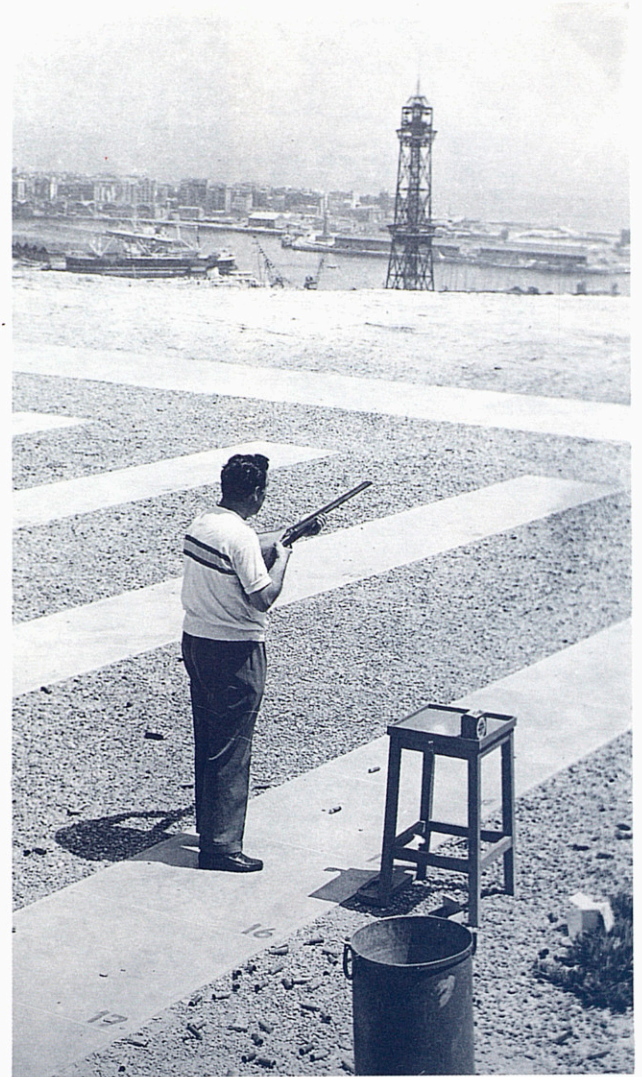
Proves de tir al plat, a Miramar.