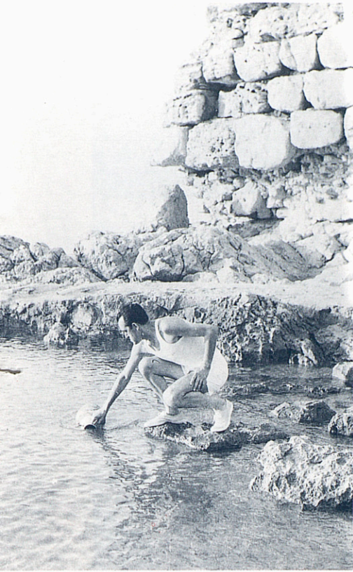
El moment en què es recollí amb una àmfora al peu del port grec d'Empúries l'aigua que seria portada a l'estadi de Montjuïc.