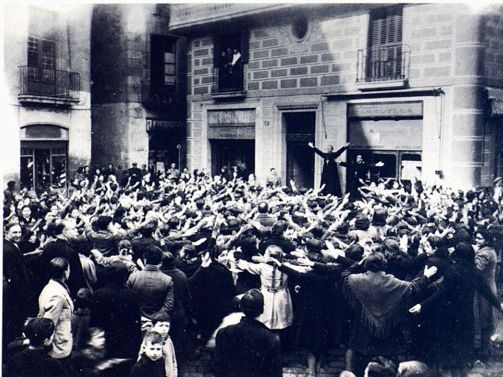
Prèdica religiosa en un indret no identificat de Barcelona, el 1940. Negatiu 6 × 9.