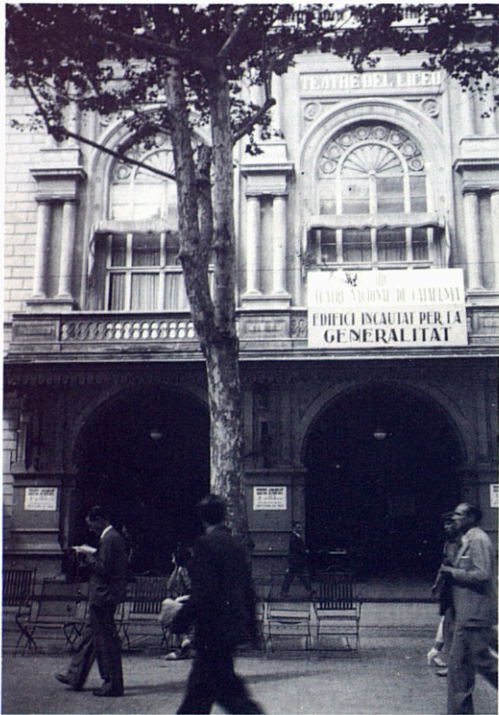
El Teatre del Liceu, confiscat per la Generalitat els primers dies dels fets del juliol de 1936, convertit en Teatre Nacional de Catalunya. Negatiu 6 × 9.