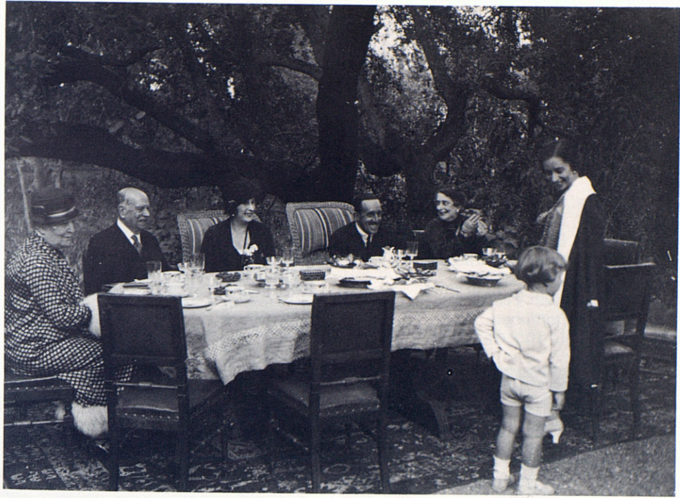
Alfons XIII i la família reial al jardí de la finca del comte d'Egara, el 1919. Negatiu 6 × 7.