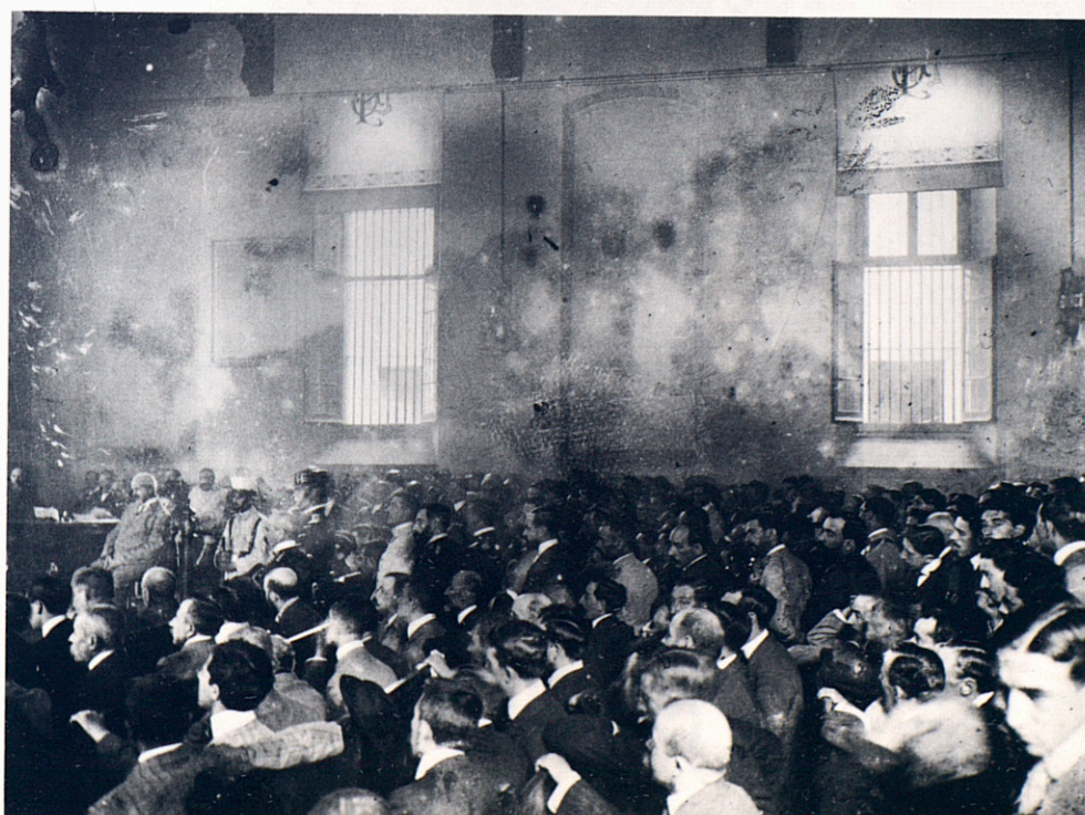
Una de les dues fotografies que es conserven del consell de guerra contra Francesc Ferrer i Guàrdia, acusat pels fets de la Setmana Tràgica, que es va celebrar en una sala de la Presó Cel·lular de Barcelona, el 9 d'octubre de 1909. La va fer amb una càmera construïda per ell mateix, amagada sota l'armilla. Negatiu 6 x 7.