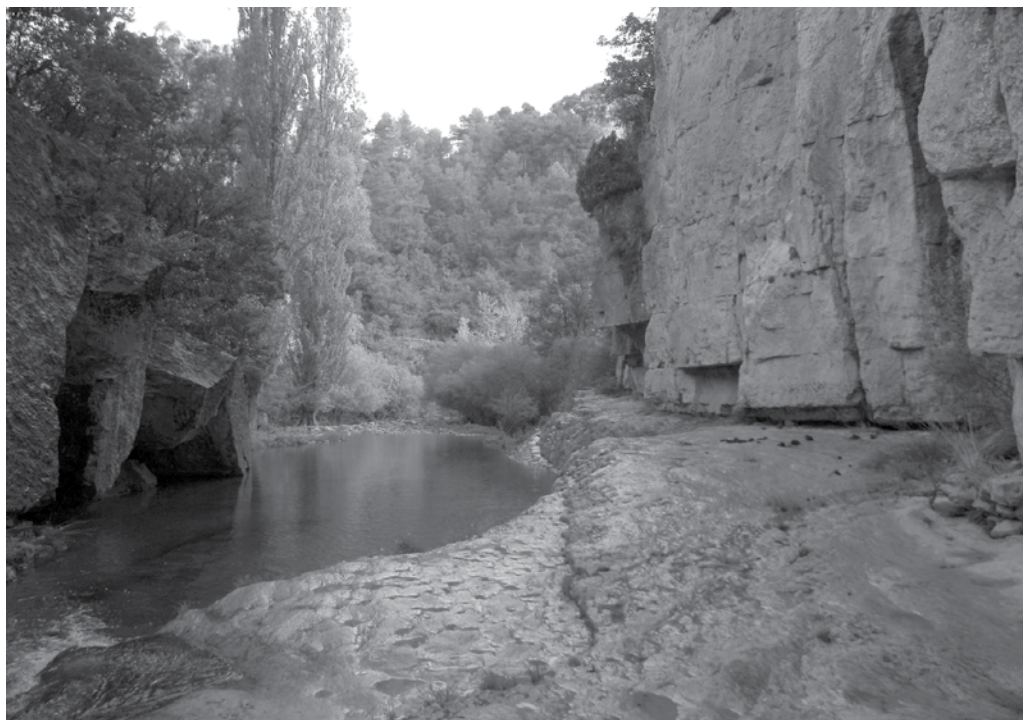
Paratge de la Fou , prop de la Manugra.