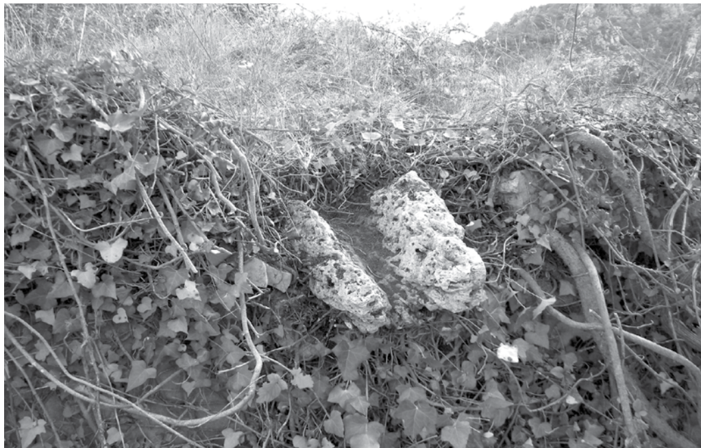
Canal de pedra tosca a les Sortasses.

El tossal del Xanda. Damunt de la Font Nova i al costat del camí de Reus.