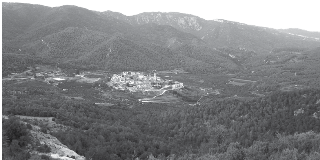
La vall de Capafonts.