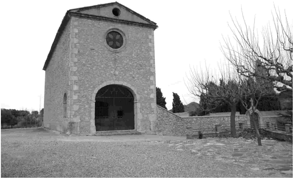
Sant Antoni de Pàdua. Vilanova de Prades.

Es tracta d'una ermita construïda a càrrec de tres dones, com a agraïment per haver-se lliurat de la pesta, el segle XIX.