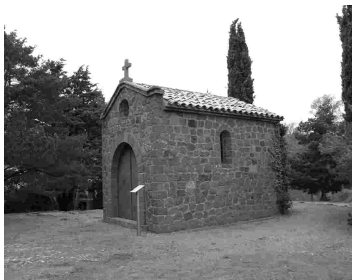
Sant Antoni. Prades.

Des de l'ermita es pot contemplar un paisatge enormement ampli, que va des de les muntanyes del Montmell, a llevant; als Montllats, al sud; i al Gallicant per ponent.