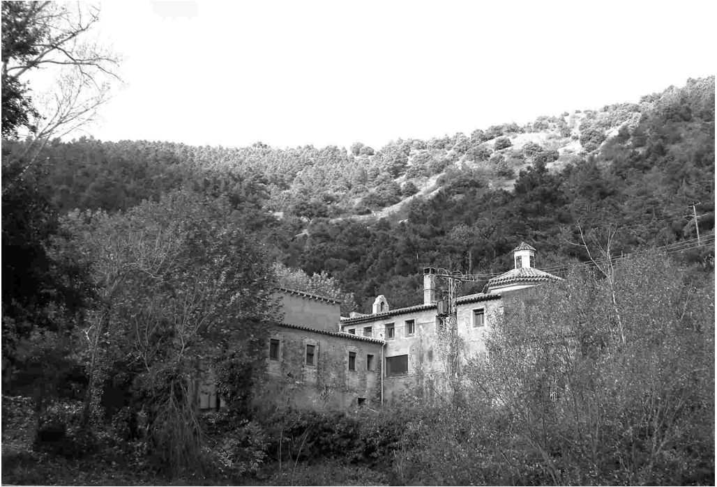
La Santíssima Trinitat. L'Espluga de Francolí.

La imatge original fou destruïda l'any 1936, i cinc anys després, l'escultor Frederic Marés en feu una altra. Representa a Déu Pare assegut, que sosté a Jesucrist crucificat, i a sobre, el colom símbol de l'Esperit Sant.