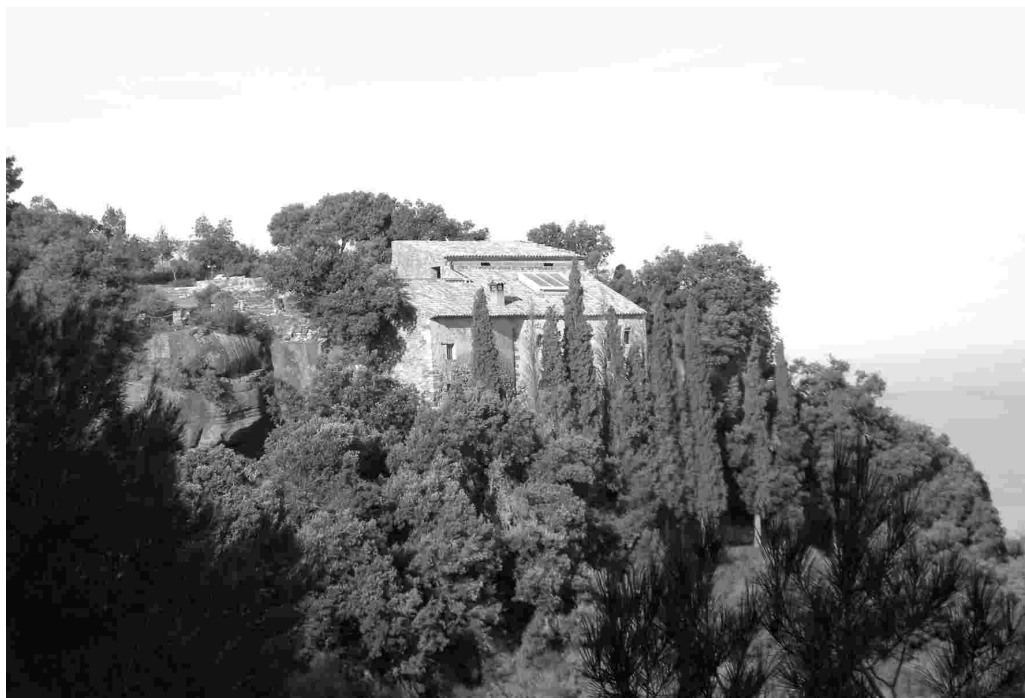
Sant Joan. Montblanc.

L'entorn és ombrívol, amb uns xiprers al davant i una vegetació pròpia de l'obac de la serra: pinedes i alzinars on vegeten també els roures, amb un sotabosc dens, que ocupen l'espai entre les roques rogenques de saldó, amb superfícies arrodonides per l'acció dels agents atmosfèrics. Tot plegat, un paisatge magnífic. Al costat de l'ermita hi ha el mirador de la Foguerada, una roca de saldó que sembla separar-se de la resta i que avança sobre el precipici, i on antigament s'encenia una foguera la nit de Sant Joan. Prop, la cova del Nialó, oberta en les capes de gresos.