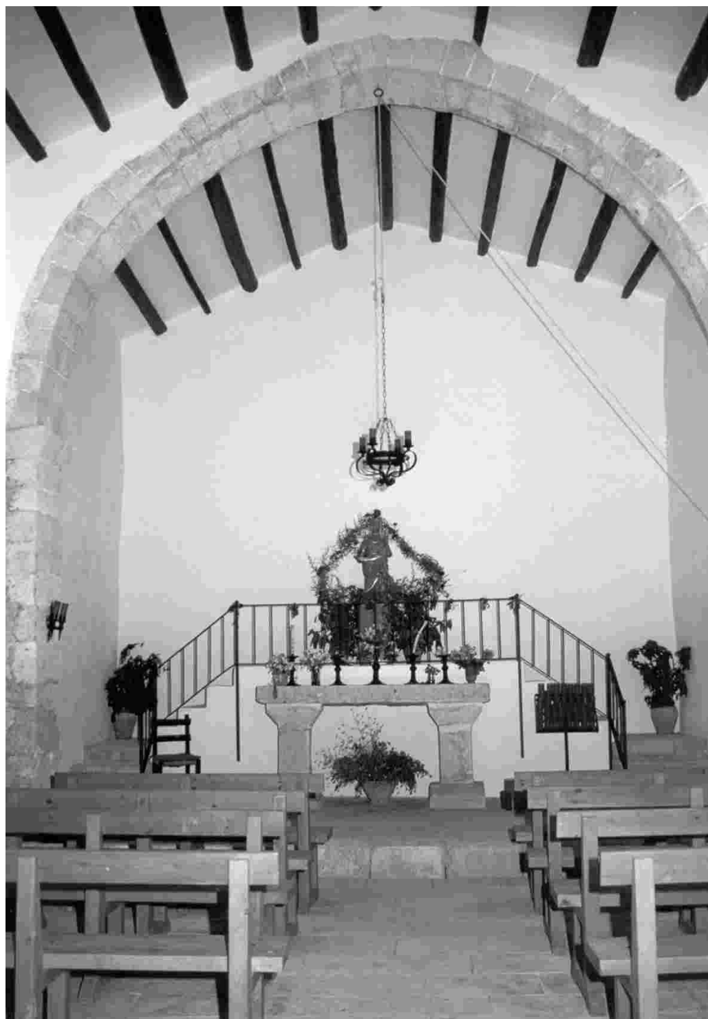
Ermita de Barrulles. Capafons