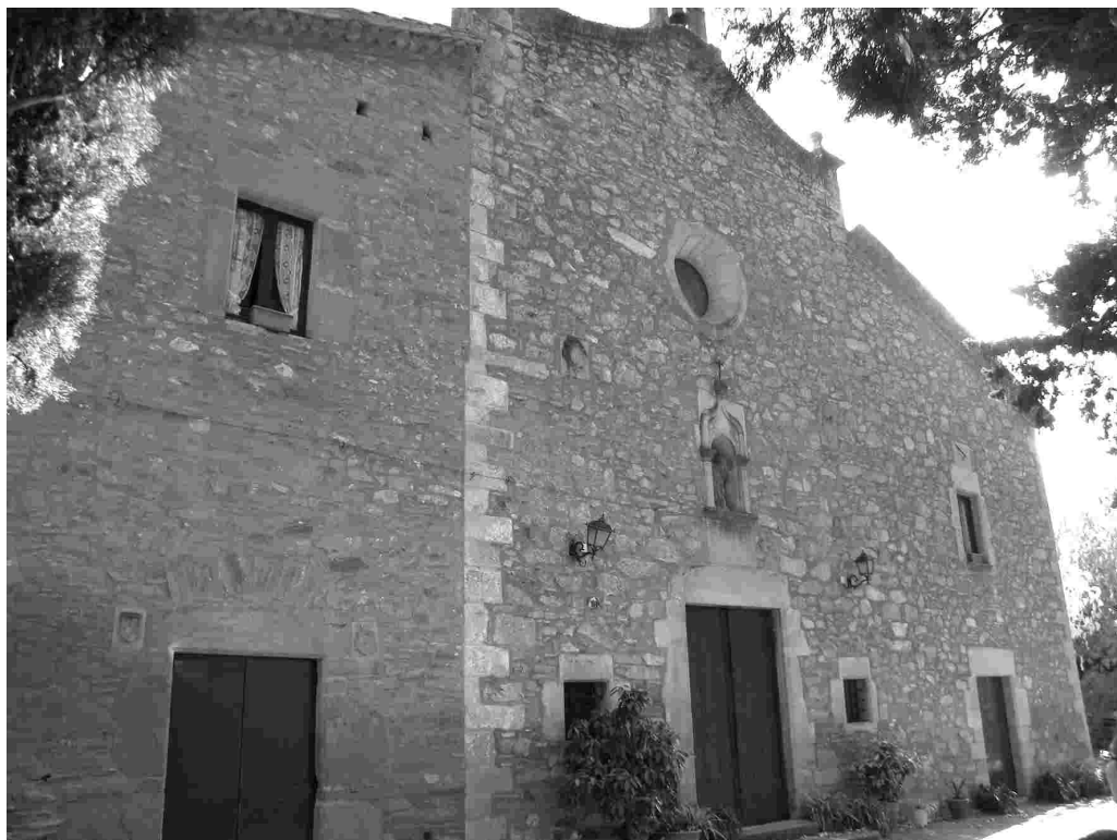
Els Torrents. Vimbodí i Poblet.

És un lloc molt concorregut per la gent del poble i per molts forasters, que aprofiten els serveis de l'espai de lleure, molt ben condicionat, i els de l'hostal i el restaurant contigu.