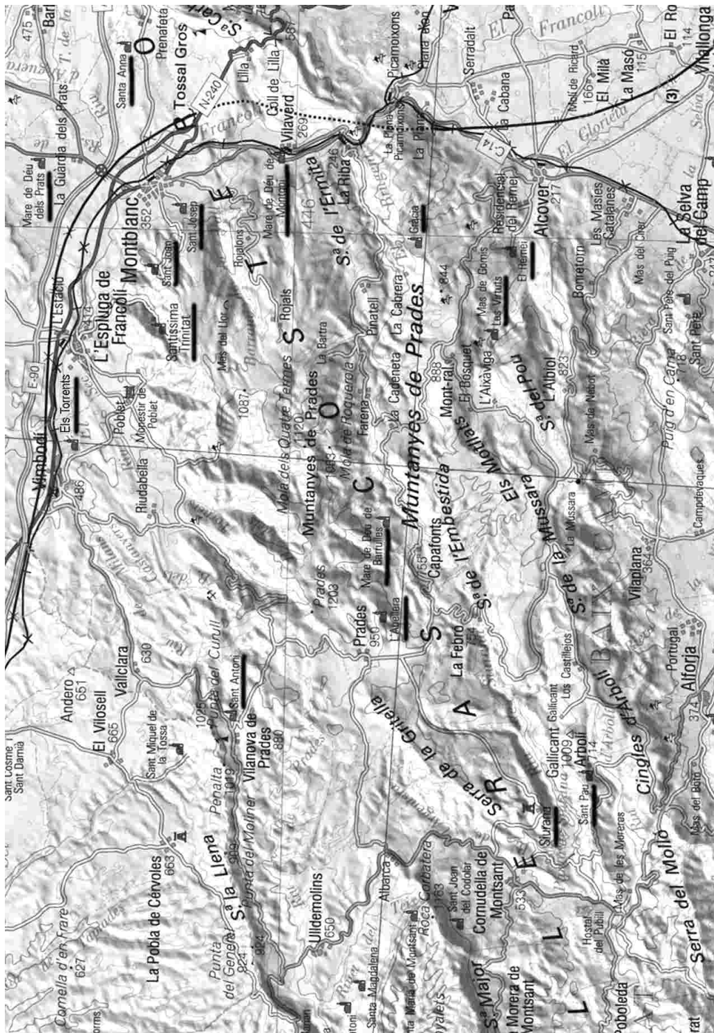
Mapa de situació de les ermites.