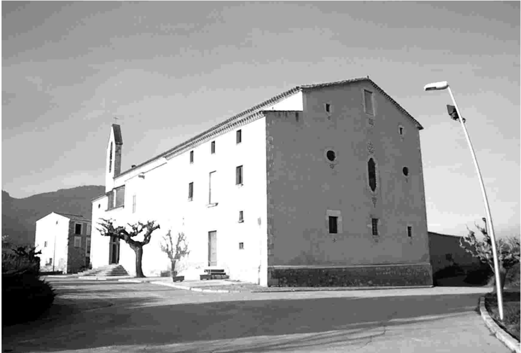
Santuari de la Serra. Montblanc

La germana, Na Elionor, es retirà a Montblanc, i des del 1414 fins a la seva mort, el 1430, féu vida d'anacoreta en una cova, en el lloc on féu edificar l'ermita.