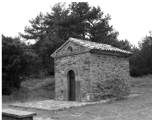
Sant Roc. Prades.