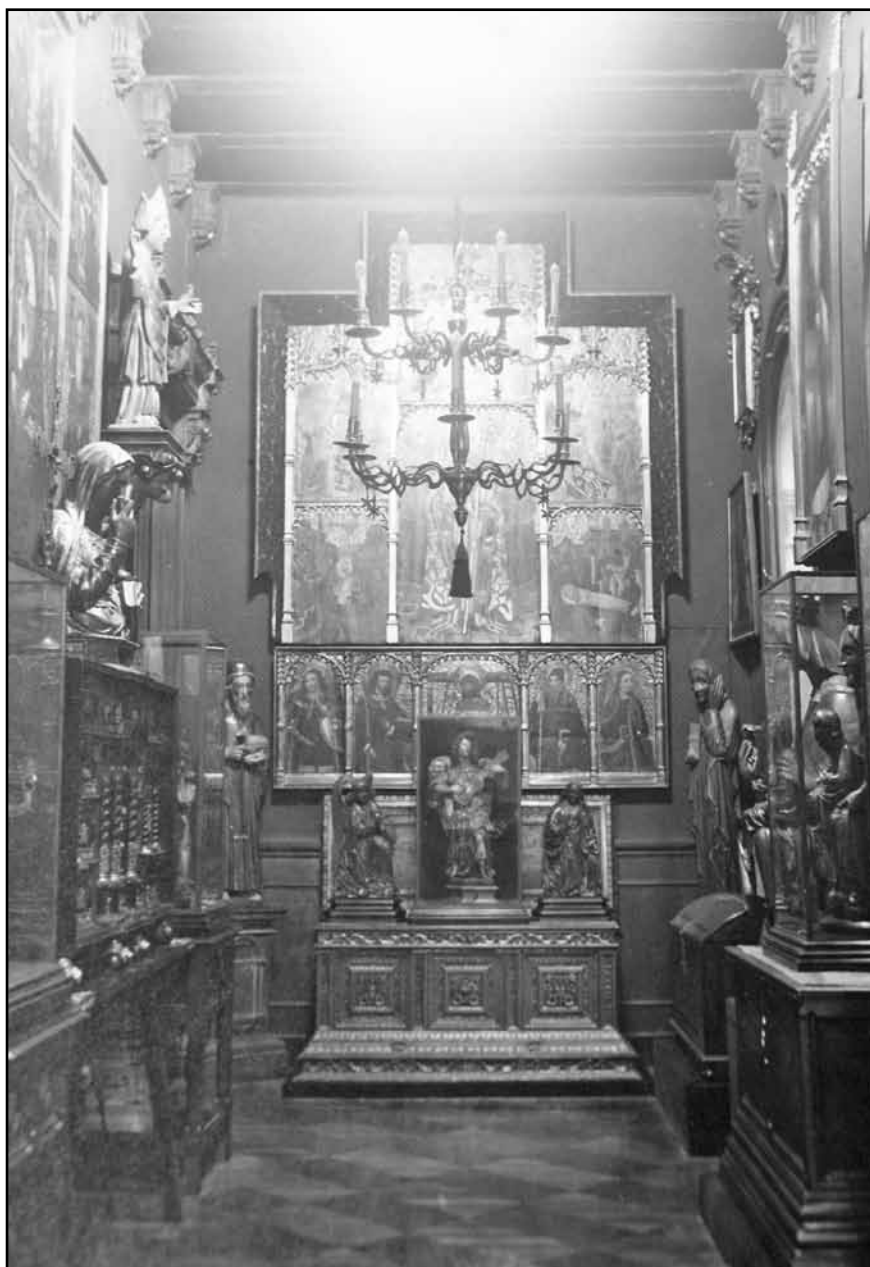
Interior de la casa Muntadas al carrer Llúria de Barcelona: "Antesala" centrada pel retaule de Sant Fost.