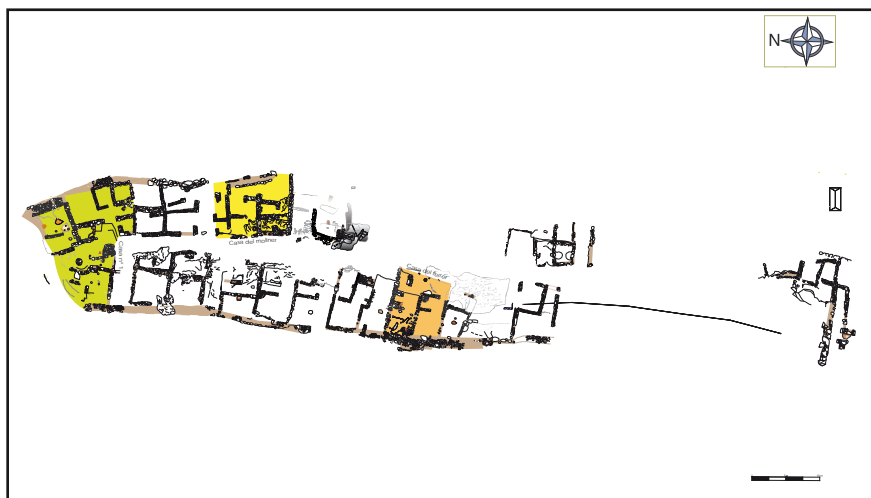
Planta del poblat ibèric de les Maleles amb les principals cases estudiades.

intervenció. Amb posterioritat el jaciment va ser objecte de petites intervencions, durant els anys 1943-1948 i 1955-1956 quan intervé J. M. Cuyàs 2 i posteriorment Font i Cussó 3 , J. Fàbregas Bagué 4 , l'agrupació d'AGES de Santa Coloma de Gramenet i el Centre Excursionista de Montcada Bifurcació.