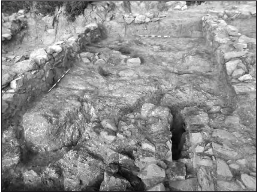
Vista general de l'àmbit 3 o taller de forja.

quantitat d'àmfores i l'existència de diferents molins, especialment un de giratori de grans dimensions, determinà un habitatge dedicat a la gestió i transformació dels excedents cerealístics destinats a la comercialització.