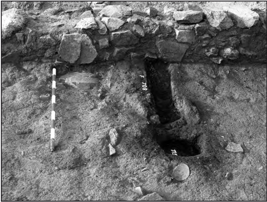
Detall de les restes conservades del forn de forja.

jecció d'aire dins d'aquesta estructura i poder aconseguir la temperatura adient (900 °C), per escalfar el ferro i poder-lo treballar. Tot i la unió imprescindible entre forn i toveres no hem recuperat cap fragment d'aquestes en l'excavació d'aquest espai. Sí que s'ha localitzat una important concentració d'escòries de ferro al peu de l'entrada així com moltes d'altres porcions disseminades per l'estança, producte dels darrers treballs efectuats. Altres particularitats d'aquest taller aporten dades rellevants i singulars sobre la tècnica emprada, com és el cas de la canalització que s'obre al mur de tancament de la casa que permet l'oxigenació natural d'una zona de combustió on les peces metàl·liques agafaven temperatura abans de ser traslladades al forn de forja, sense la necessitat d'una persona que injectés aire per mitjà de toveres.