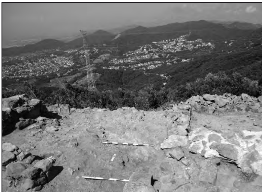
Vista panoràmica des del jaciment i al fons, Sant Fost.

servació del jaciment, tot encarregant-se de mantenir les estructures excavades lliures de matolls i evitant la degradació del conjunt. L'objectiu principal resideix a minimitzar la degradació de les restes arqueològiques tot apostant per la conservació del conjunt.