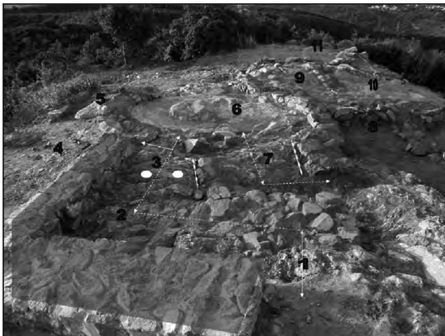
Vista de la casa 1 on s'observen fins a 11 àmbits dels 12 identificats en el conjunt.

posades en cubeta, un petit forn domèstic i la base d'un capfoguer, ens fa pensar en un espai dedicat a l'activitat culinària però a gran escala o si més no amb estris o mètodes restringits. Sabem que l'ús dels capfoguers no es freqüent i s'utilitzaria en àmbits distingits i moments de celebracions o festes. Cal destacar també la identificació en aquest mateix àmbit d'una estructura per fumar la carn. Aquesta tècnica culinària reservada per a famílies amb una bona posició social, s'utilitzava per conservar la carn i el peix durant llargs períodes de temps.