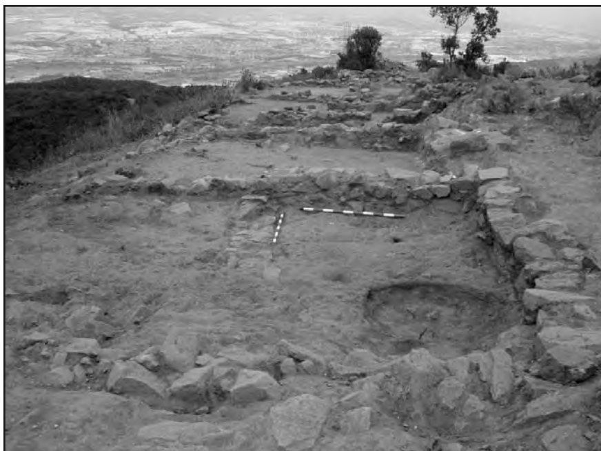
Àmbit 5 de la casa del ferrer, on s'observa la base d'un forn reductor de secció tubular que evidencia una major especialització en la tècnica metal·lúrgica.

Pel que fa a l'àmbit 5, reservat inicialment a la vida domèstica, pateix una transformació amb el pas del temps, ja que acollirà la infraestructura necessària per treballar amb una major i millor especialització el ferro. En aquest espai es localitzà la cubeta d'un forn de reducció de ferro de planta circular i secció tubular, amb el qual s'obtenia el masser de ferro que passava a ser treballat en l'àmbit 3 escalfat amb el forn de forja i convertit en un objecte.