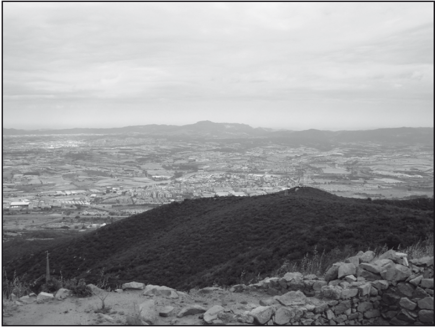
Vista panoràmica des del jaciment.