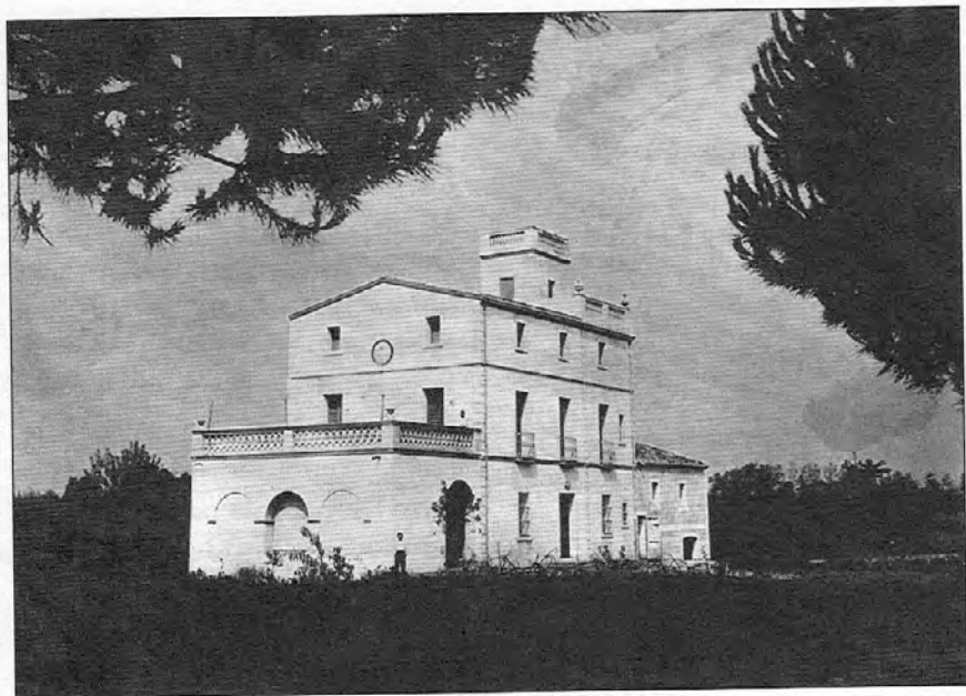
La Torre Esbert, primera casa de l'actual barri de Can Calet, vers 1903.