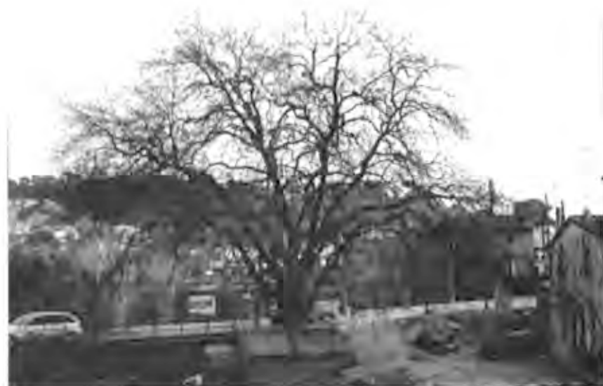
El roure de Cal Roig. Febrer de 1998