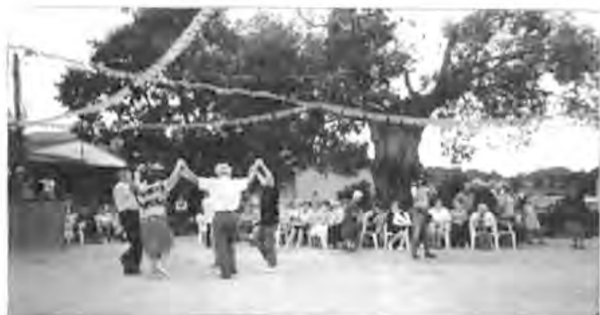
Festa del patró Sant Faust a vedós del vell lledoner de la Plaça de les Glòries Catalanes. Setembre de 1997

tota mena d'estrís, tenint com a únic límit el de la imaginació. Avui dia són les diverses celebracions lúdiques i esportives de la Festa Major que tenen lloc sota les branques d'aquests arbres.