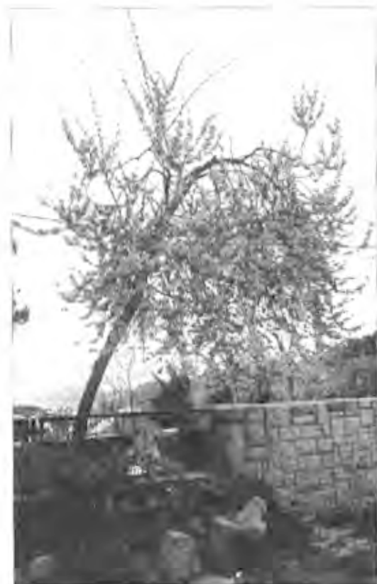
Arbre dels Nassos en plena floració davant el Seminari Menor de La Converia

quals era molt maca. Un cavaller de les rodalies se'n va enamorar i la va començar a festejar. La monja va demanar al cavaller que la deixés estar i per persuadir-lo d'una manera definitiva, es va tallar el nas amb una daga. Diu la