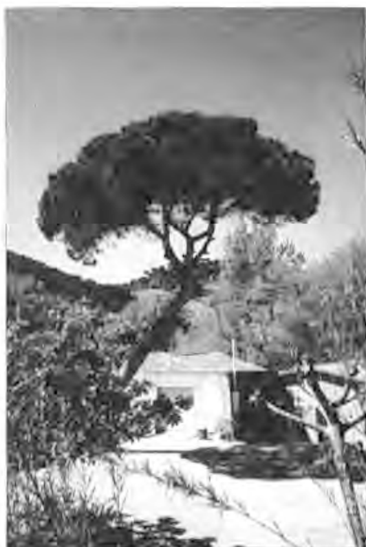
Pi de Can Escolà

4,80 metres de perímetre (3) , s'ha anat buidant amb el pas del anys i actualment això s'ha convertit en un greu problema, ja que corre perill d'esberlar-se. Afortunadament, s'estan aplicant diverses mesures per evitar el deteriorament de l'arbre més emblemàtic de Sant Fost (4) . Aquest lledoner podria tenir uns quants segles d'antiguitat, ja que hi ha qui creu que quan es construïa una església hi plantaven un lledoner a trenta passes per a marcar els límits de la sagrera parroquial, com és el cas de Sant Fost. L'església romànica de Sant Fost va ser consagrada l'any 1141, la qual cosa ens pot donar una idea de l'edat d'aquest arbre tan venerable. A Santa Maria de Martorelles també hi ha plantat un lledoner a prop de l'església.