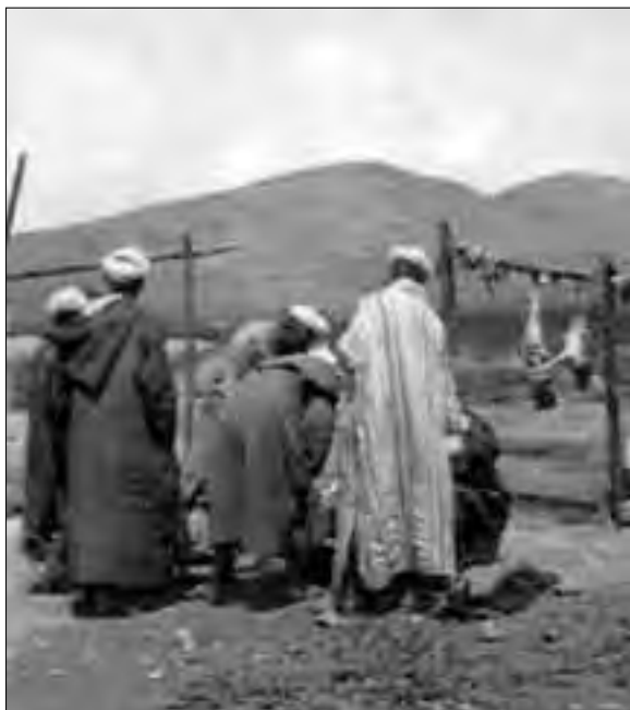
Venda de carn a l'aire lliure, 1948.

A Melilla hi havia jueus, moros i cristians. D'una banda els jueus, propietaris de la majoria de comerços, botigues i bancs, són gent de bona posició econòmica, vivint en bones cases amb tota les comoditats d'aquella època. D'altra banda els cristians, la gran majoria procedents de la Península, militars d'alta i mitjana graduació, i civils ocupant tots els estaments públics i privats, i tots vivint bé, més o menys com els jueus. Entre aquesta classe social i els moros hi ha els de classe treballadora i amb ells els sotsoficials i també els caporals de primera, la majoria homes grans, casats i amb una paga molt minsa. La classe treballadora estava formada per espanyols, quasi tots d'Andalusia, que feien els oficis de manobres, lampistes, mecànics, fusters, etc.