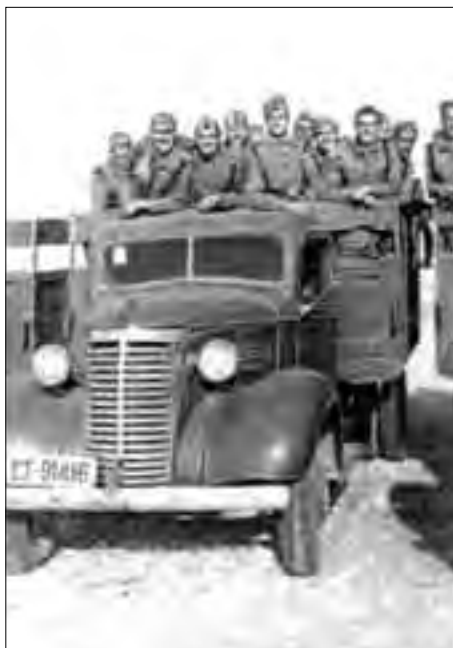
Soldats espanyols de maniobres a Mar Chica, Melilla, novembre de 1947.

orinar o a fer de ventre, i ell es va tornar a dormir. Quatre o cinc soldats veterans, armats amb el mosquetó, munició i motxilla amb queviures i aigua, sortiren a buscar-lo i tornaren al cap de dos o tres dies. L'havien trobat gràcies a un grup de corbs que voleiaven fent cercles sobre un punt concret. Allí el trobaren, tot nu i lligat de mans; l'havien sodomitzat i matat. Vaig recordar l'arena que ens donaren al pati de la caserna el dia de la nostra arribada. El cadàver el dugueren a Melilla i nosaltres vàrem seguir fent, com si res no hagués passat.