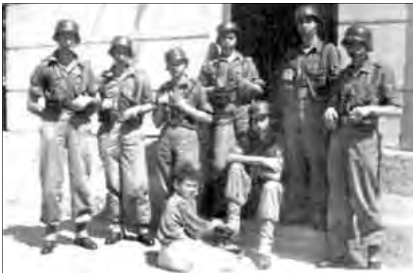
Soldats del cos de guàrdia en un moment de descans, Melilla, 1948.

Els serveis de neteja consistien a netejar les latrines, que eren uns plats de porcellana amb un forat al centre. Per netejar-ho s'usava una mànega amb aigua a pressió ajudant-se amb una escombra. El servei de cuina era sobretot pelar patates, hores i hores pelant fins que els dits et feien mal de tant agafar el ganivet, però encara era pitjor si et tocava netejar els estris de cuina: olles i cassoles de ferro grandioses, enormes, doncs quedaves xop i enllardat en extrem. Per això tothom intentava buscar-se un “ enchufe ”, una recomanació per poder-se deslliurar dels serveis, excepte els de guàrdia, dels quals era impossible lliurar-se. Després d'una sèrie de gestions, i tenint en compte els meus