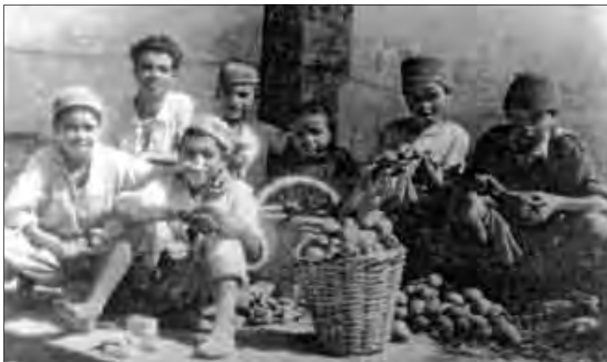
Nens rifenys venent figues de moro.

menys encara per als soldats. Podíem anar al cinema, anar al Real , al Polígono , que eren dos barris de la ciutat, també podies anar de putes. La Plaza de España era el lloc més adient per passejar-hi, ja que era bastant gran, amb arbres, jardins i bancs. El carrer més transitat per la seva situació i elegància era l' Avenida del Generalísimo , amb bonics edificis, establiments selectes, caixes i bancs, clubs i terrasses de cafè i salons de te. Era un passeig lloc de cita de la joventut benestant, que junt amb militars d'alta graduació i alguns jueus adinerats omplien les terrasses de clubs i cafeteries. No hi havia per aquesta avinguda moros esparracats demanant almoina, puix la policia militar els feia fora perquè no molestessin els senyors arrapapats. A l'estiu anàvem a la platja anomenada Mar Chica, una llacuna a l'est de Melilla, de 20 km de llargària per 10 d'amplada, sense onada de cap mena. Anàvem en grups i un de la colla es quedava a guardar la roba, perquè a la més mínima te l'havien fotut.