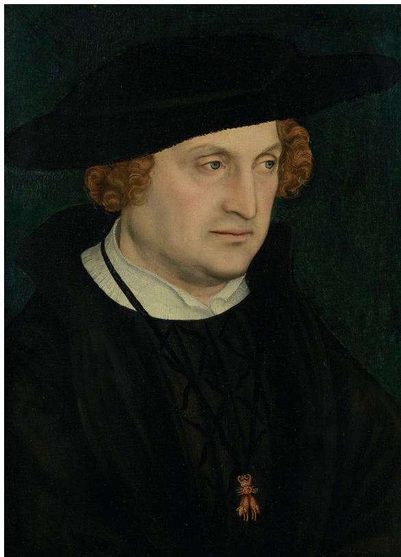
Figura 1. Joan de Brandenburg, amb el Toi-só d'Or, per Lucas Cranach.