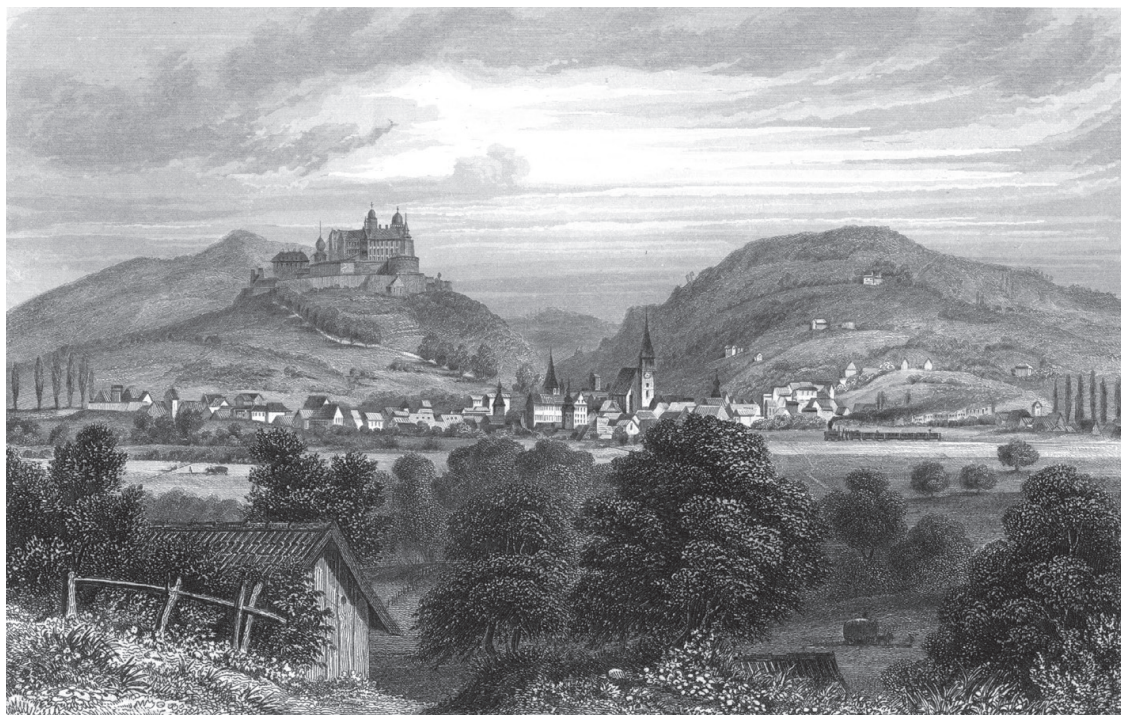
Figura 2. Kulmbach i el castell de Plassenburg.