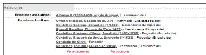
Figura 4. Mostra de les relacions vinculades al I comte d'Oliva en PARES 2.0.

Encara que la ferramenta més útil des del punt de vista genealògic siga el camp «Relaciones».