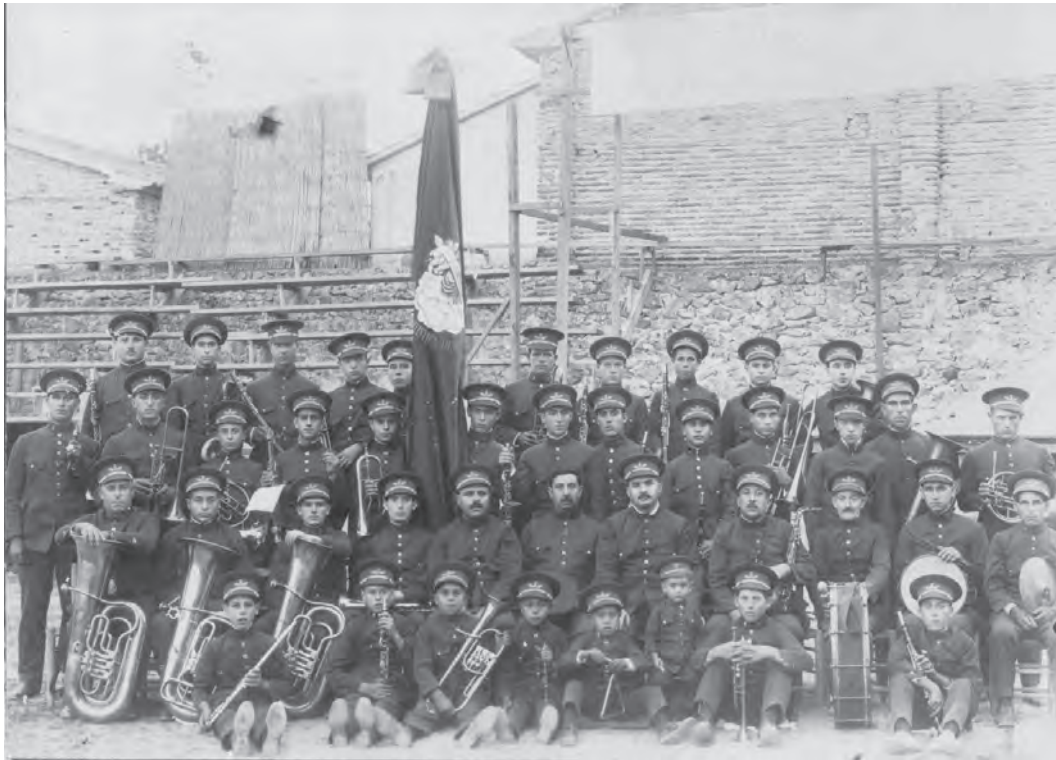
Foto 4. Banda Municipal d'Oliva. Fotografia datada entre 1923 i 1930.

havia fundat la banda de Muro i hi va viure fins a 1920. És un compositor reconegut en el camp de l'aleshores incipient música de Moros i Cristians, com a creador de les primeres marchas árabes . Una vegada instal·lat a Oliva, en 1922, va compaginar la tasca de director de la banda amb les classes particulars de piano —majoritàriament a xiques—, tocant el piano als cines i cafés, així com també va obtindre la plaça d'organista de Santa Maria —en l'arxiu parroquial es conserva un Trisagio de la seua autoria—. Aquesta plaça tenia l'únic benefici estatal, a excepció de la catedral de València, de tota la diòcesi (Climent, 1988, 381). Tant el germà com els seus fills també tocaven a la banda de música. En la imatge següent, s'hi pot veure els membres d'aleshores, entre els quals es trobaven uns quants Esteve.