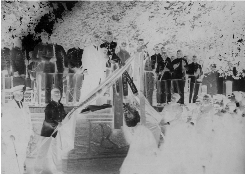
Foto 2. Imposició de dossers (banda) a les banderes de les agrupacions d'Oliva i Carcaixent (Arxiu Aigües Bolinches).

L'acte solemne, segons les cròniques, va estar amenitzat per les bandes d'Oliva i de Carcaixent. D'aquesta ciutat provenia Pascual Bolinches i el director de la banda de la Ribera Alta en aquell temps era Juan Gascó Camarena, compositor i director d'Oliva que havia treballat a Sueca amb el mestre José Serrano (1873-1941) (Escrivà-Llorca, 2019). En la foto 1, es pot veure com els músics de la banda de Carcaixent, amb uniforme blanc, estan tocant mentre la comitiva arriba a algun lloc. Cal pensar que la foto 1 és prèvia a la foto 2, on es pot veure la banda de Carcaixent a dalt d'un cadafal —possiblement al passeig— en el moment de posar els dossers —o bandes commemoratives— de l'efemèride.