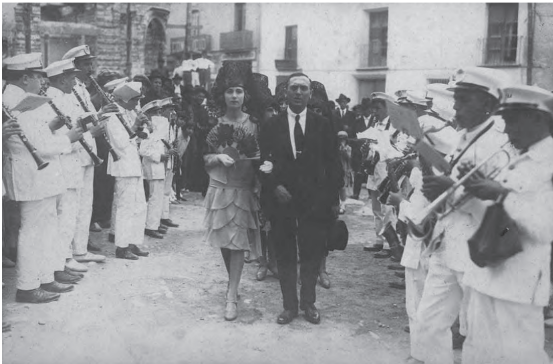
Foto 1. Passacarrer i benvinguda. Músics de la banda de Carcaixent tocant.

El 17 de juny de 1928 es va produir a Oliva un fet molt destacat, recollit en les cròniques i abastament document. Després de diversos mesos de treballs burocràtics i tasques fatigants, va arribar al poble el subministrament d'aigua potable atorgat a Pascual Bolinches Oroval. Aquest esdeveniment no hauria de ser més que una anècdota en un article d'aquestes característiques per a parlar de la banda, però precisament gràcies al material fotogràfic i a les notícies conservades, es pot obtenir molta informació de la Banda de Música d'Oliva a finals dels anys 20 del segle xx, algun dels seus músics i part del repertori. 1