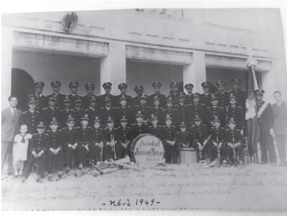
Foto 6. La Banda de Música d'Oliva en 1949.

guardonar amb el 2n premi del X Festival de Música Festera d'Alcoi en 1973. Actualment, aquest pasdoble té una consideració molt significativa per a la Banda de Música d'Oliva.