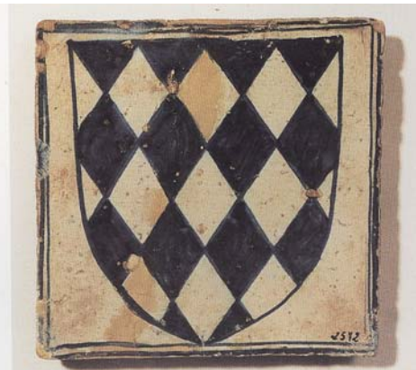
Llinatge dels Centelles, taulell de procedència desconeguda. Museu Nacional de Ceràmica i de les Arts Sumptuàries "González Martí". València.