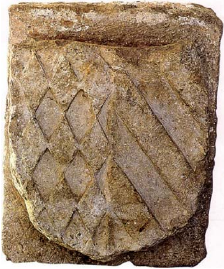
Llinatge dels Centelles Riusech (Museu Arqueològic de Nules)