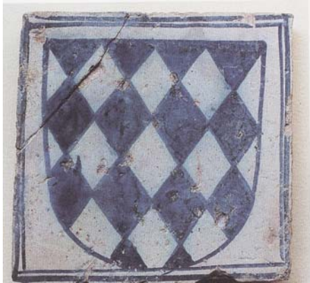
Llinatge dels Centelles, taulell procedent de la capella del castell de Nules. Museu Arqueològic comarcal de la Plana Baixa. Borriana.