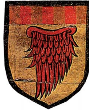
Llinatge Sanç, atorgament de les armes reials dimidiades (reduït el nombre de pals d'Aragó)