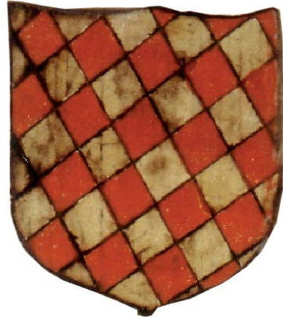
Llinatge Centelles, tractat Bernat Mestre I (Universitat de Salamanca-biblioteca)