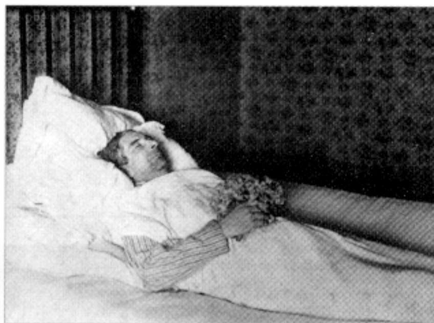
Marcel·lí Domingo, el 2 de març de 1939, poc després de morir.