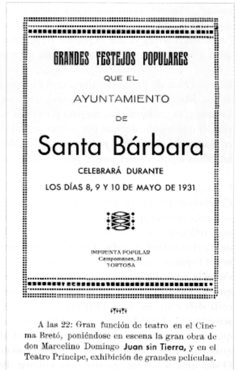
Coberta i fragment interior del programa de festes de 1931, en el qual queda constància de la representació a Santa Bàrbara de l'obra de teatre Juan sin Tierra, de Marcel·lí Domingo.

Voldria ara referir-me a una anècdota ocorreguda quan va estar empresonat en temps de la dictadura de Primo de Rivera. El van empresonar després d'escriure un article incendiari titulat "Soldados", en el qual deia que els soldats s'havien de sublevar contra el poder dels militars. El van tancar en un vaixell que es deia Reina Regente. El volien afusellar l'endemà. El capità del vaixell li pregunta si ha portat roba per a canviar-se, i diu que no. Llavors el capità li diu: "Pues nada, diga las medidas que usted necesita y mandaremos a