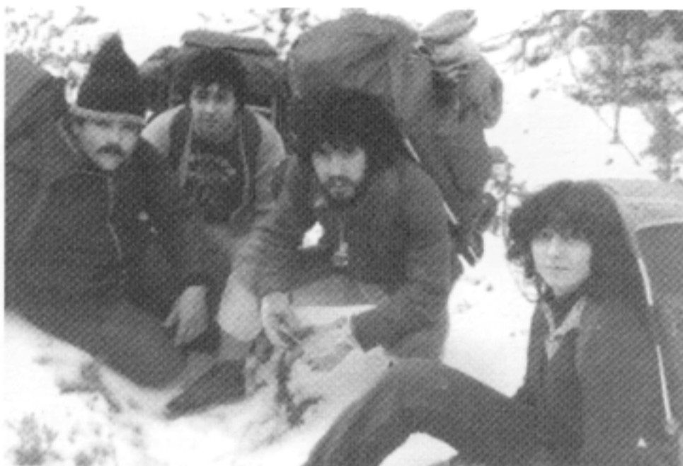
Membres de la Unió Excursionista de Santa Bàrbara –que es crea l'any 1980– en una sortida a Fredes.