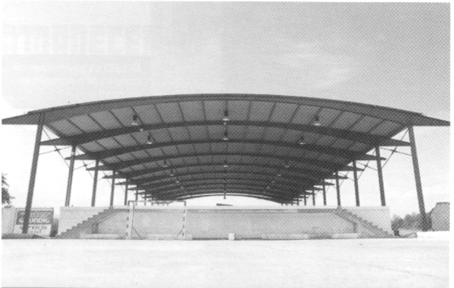
Durant els anys vuitanta també segueixen creixent les instal·lacions esportives municipals.