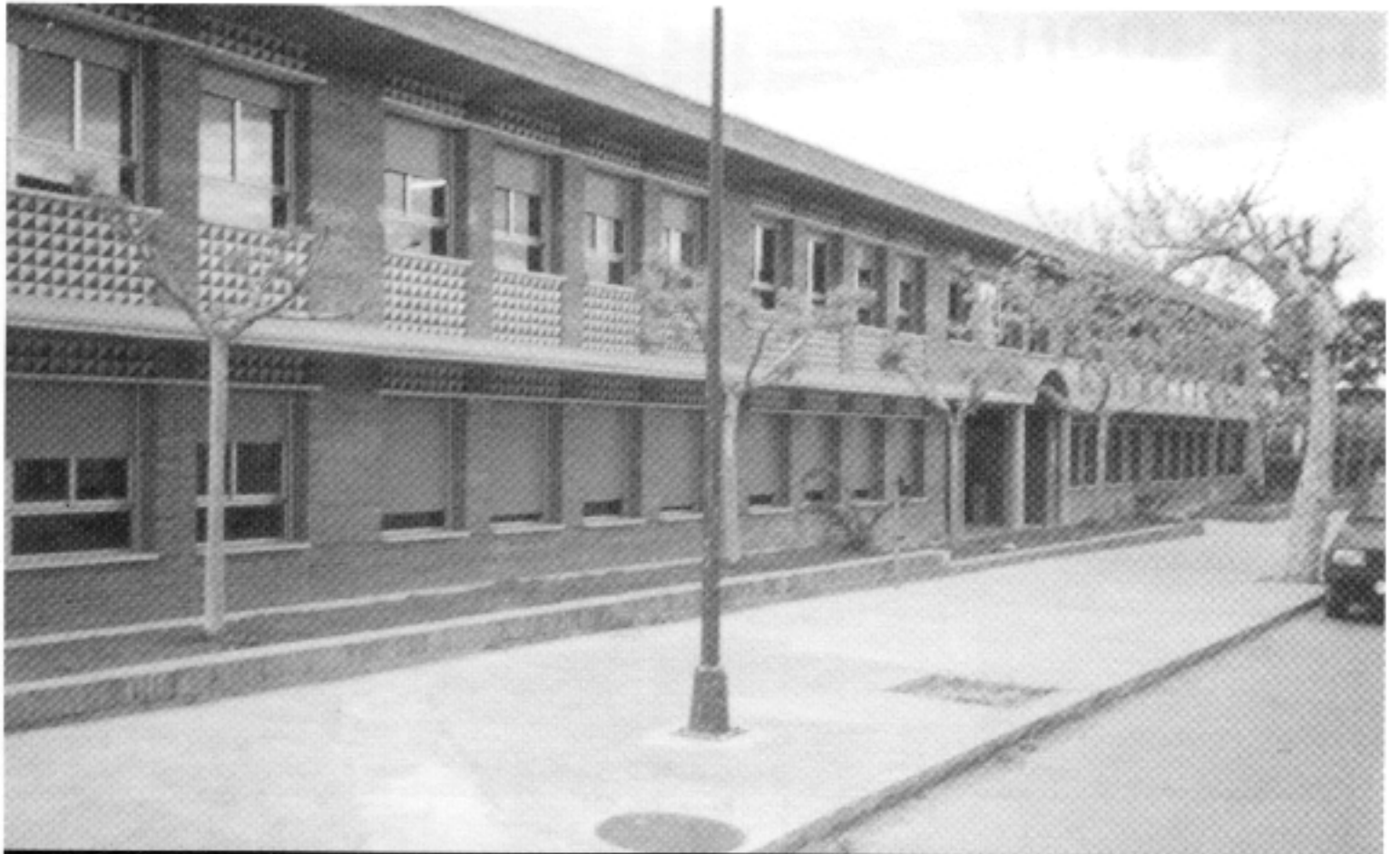
El mateix 1987 s'inauguren les noves escoles d'educació primària al solar on estaven les antigues.