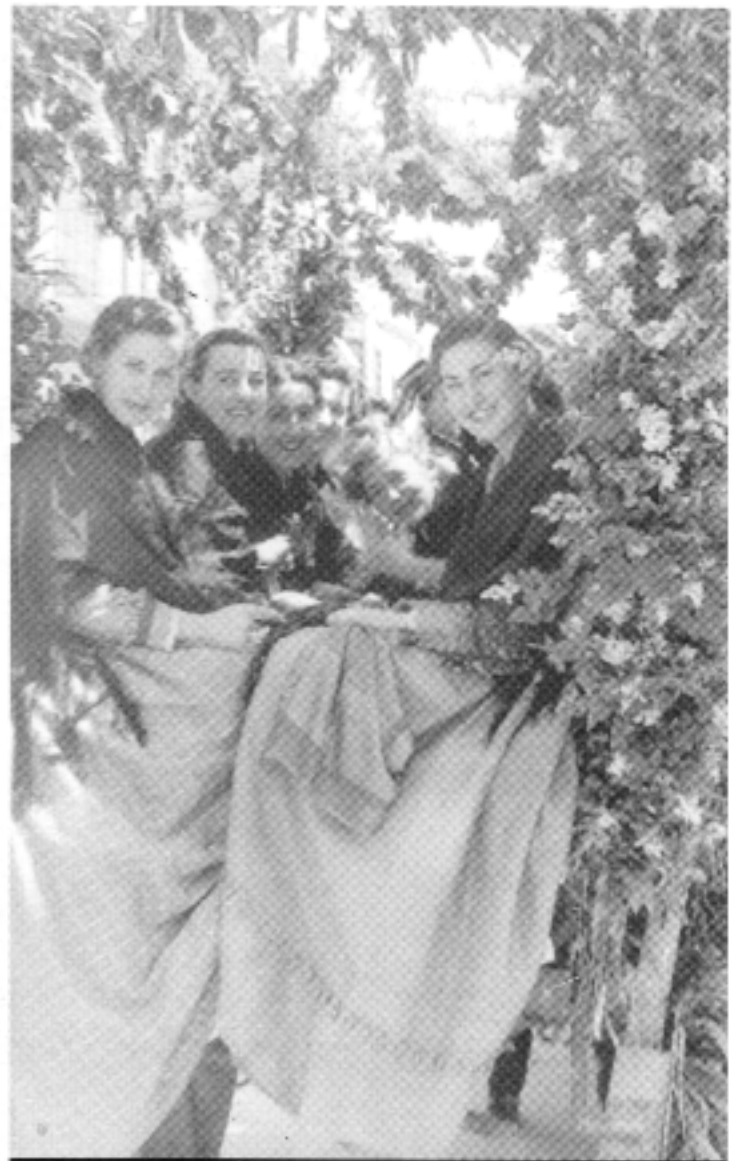
Noies a la festa de Sant Isidre de 1952.