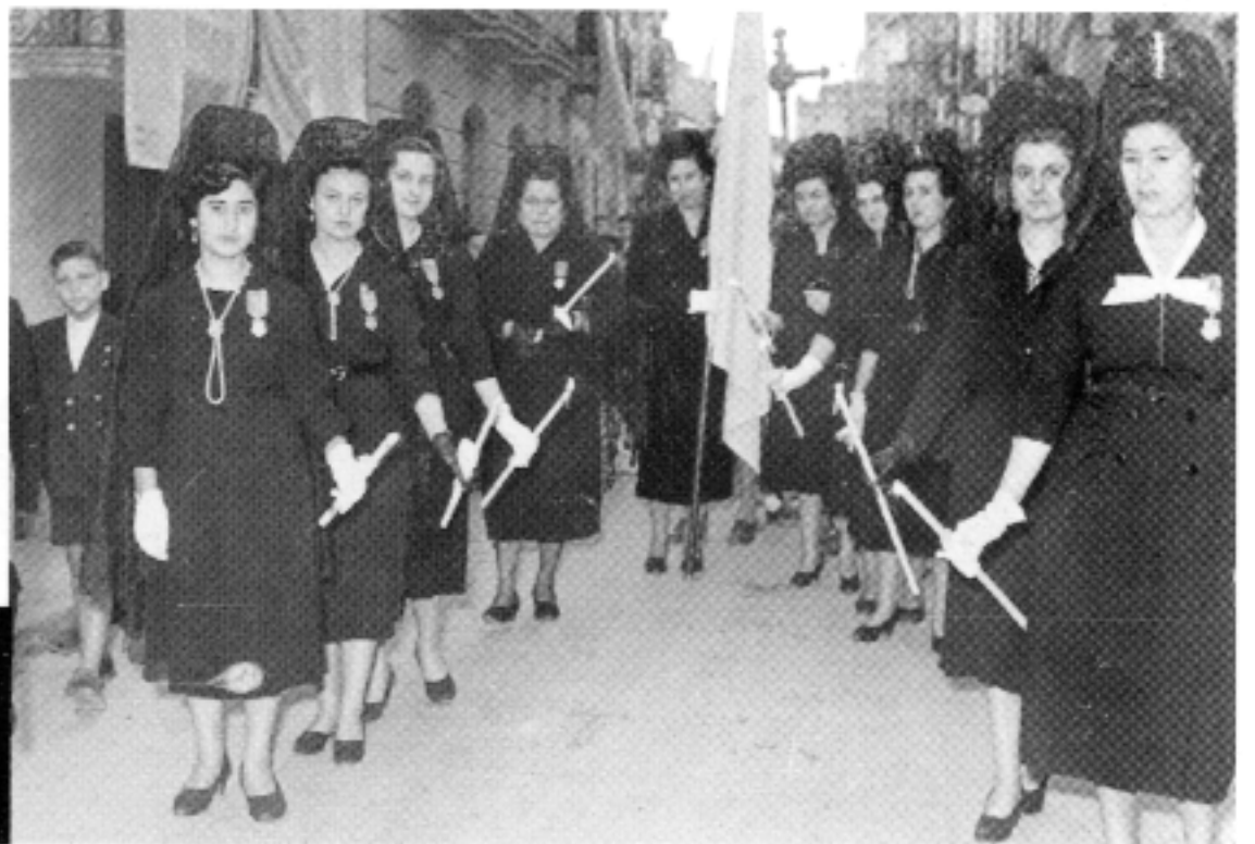
Dones dels Jueves Eucarísticos en una processó.