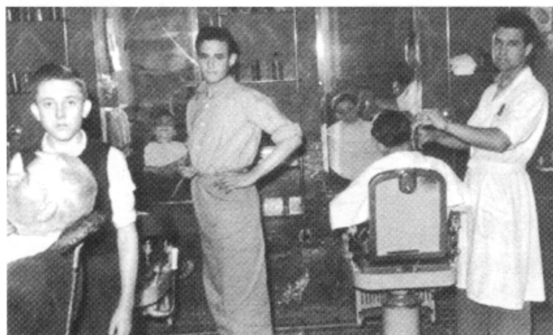
Els dissabtes les barberies s'omplen d'hòmens que van a afaitar-se i fer tertúlia. Barberia del Pardalero .