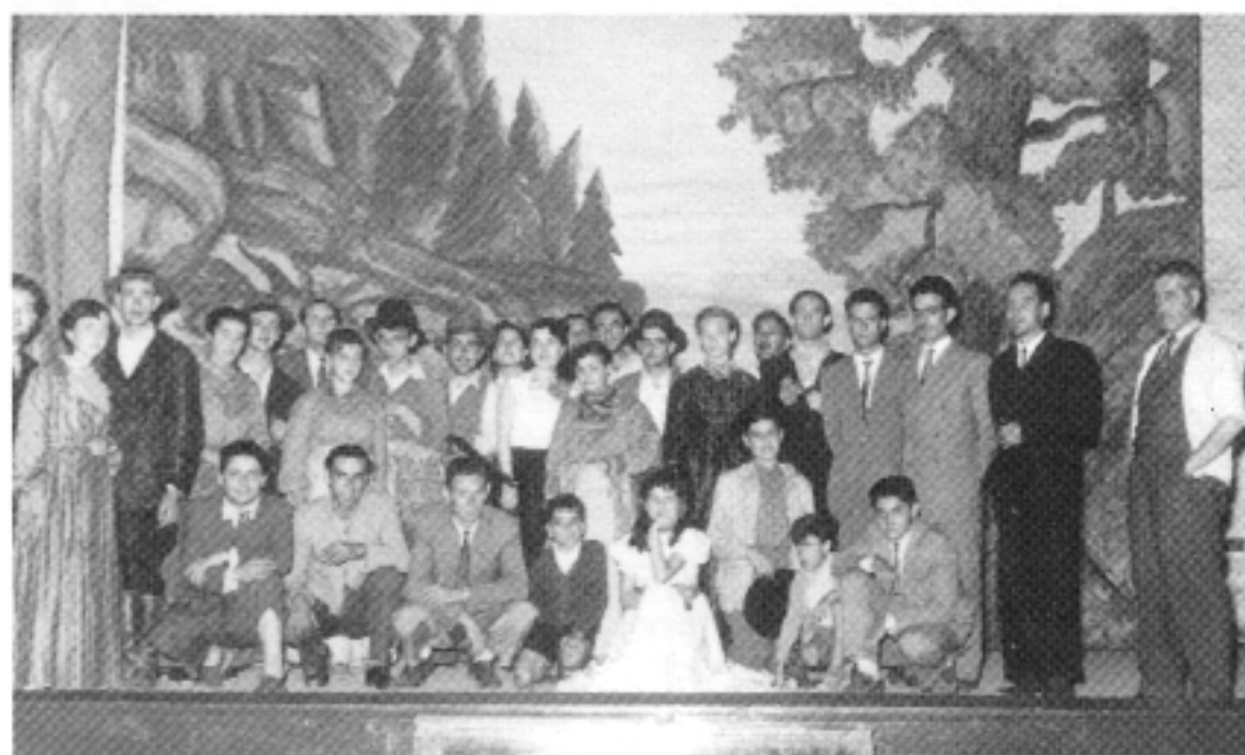
La gent assistix en massa al cine i al teatre. Representació de sarsuela al cine Moderno (1954).