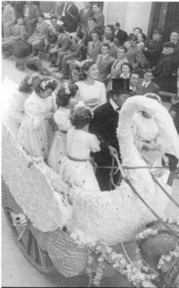
El carro igual servix per anar a treballar com per fer una carrossa durant les festes de Sant Gregori (1951).