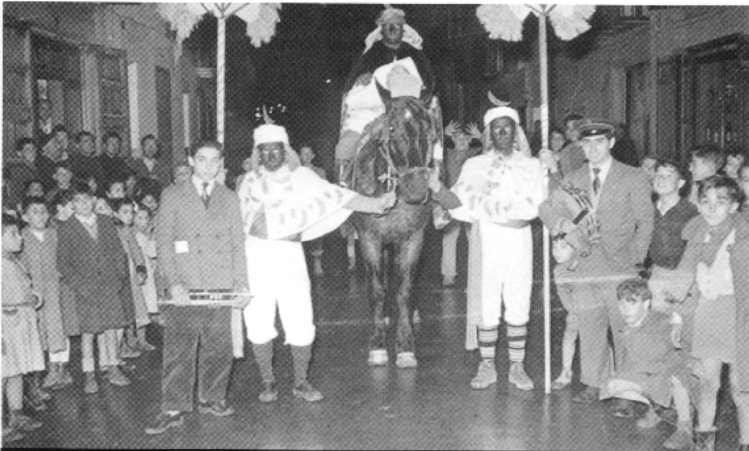
La tradició venia de lluny, però fins als anys cinquanta no arriben físicament al poble els primers Reis Mags.