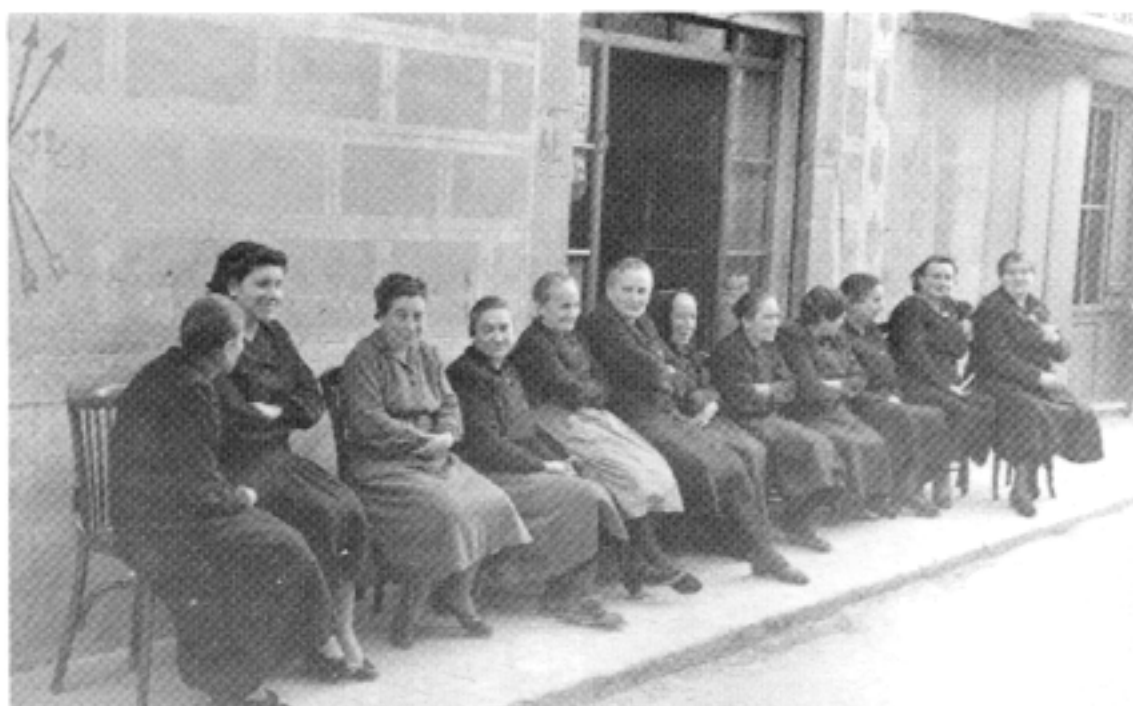
Grup de dones al carrer Major.