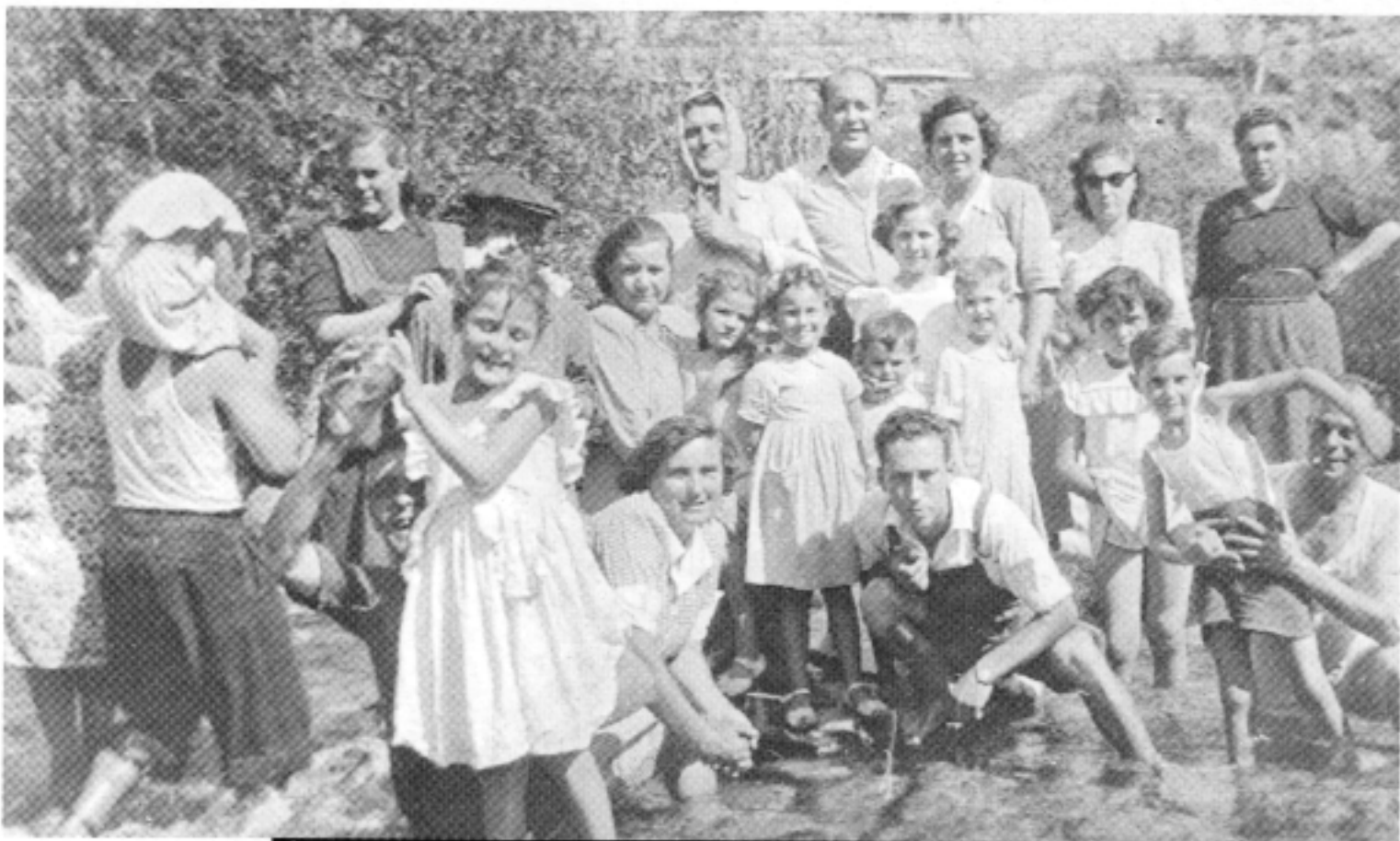
Planers d'excursió a Sant Pere, al terme de la Pobla de Benifassà.