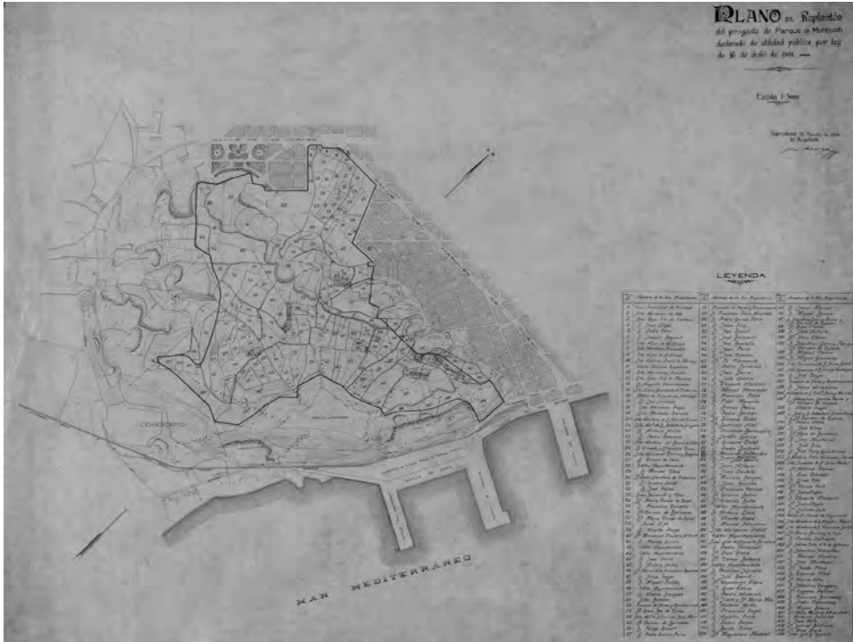
FIGURA 5. Represa del projecte del Parc de Montjuïc. Josep Amargós, 1914. AMAB, Col·lecció de plànols del Pla de la Ciutat. Pl. 7-D-7/34; r. 1225.

Amargós —el qual guanyà el concurs per urbanitzar el barri de la França el 1887—, va redactar l'avantprojecte de la urbanització rural de Montjuïc (rectificat l'any 1908).