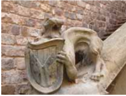
Fig. 4. Pilastra de l'escala del pati d'armes del Castell de Santa Florentina. Fotografia de l'autor.