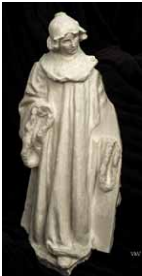
Fig. 6. Guix per a la llar de foc del saló del tron del Castell de Santa Florentina.