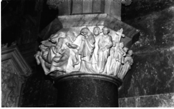
Fig. 7. Un dels capitells de la cripta del Castell de Santa Florentina.