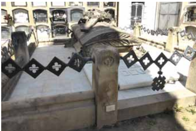
Fig. 3. Panteó Deu al Cementiri de Les Corts.