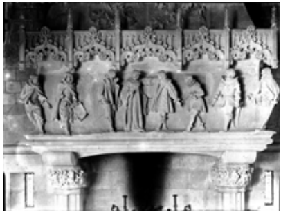
Fig. 5. Fotografia de ca. 1910 del fris decoratiu de la llar de foc del saló del tron del Castell de Santa Florentina.